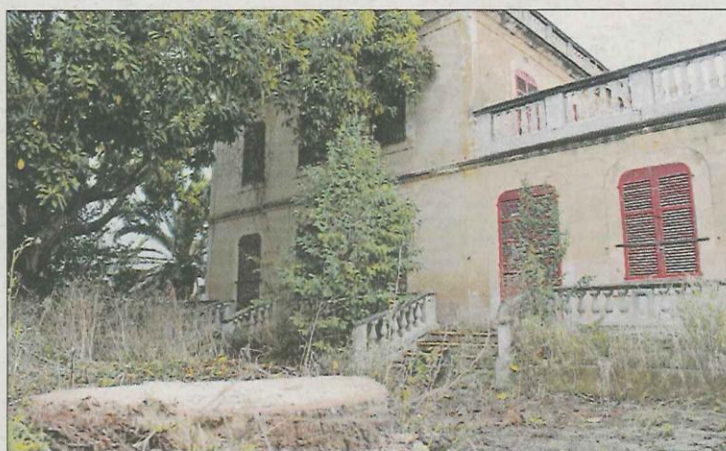
El picudo rojo también deja su marca en lo que fue Majorica. S.SANSÓ