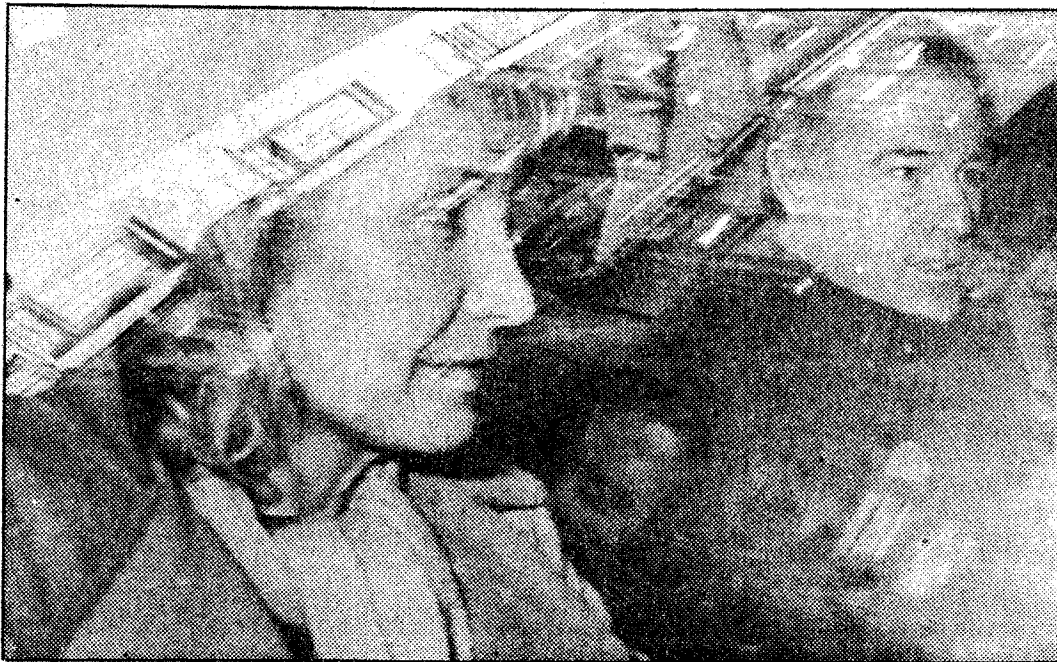
El duque de Cádiz abandona la Audiencia acompañado de la secretaria de uno de sus abogados

El fiscal elevó a definitivas sus conclusiones y solicitó para el duque de Cádiz —que resultó junto con otro de sus hijos y la institutriz que los cuidaba herido de gravedad— diez meses de prisión menor, privación durante 18 meses del permiso de conducir e indemnizaciones por cerca de 7 millones de pesetas a las personas que resul-