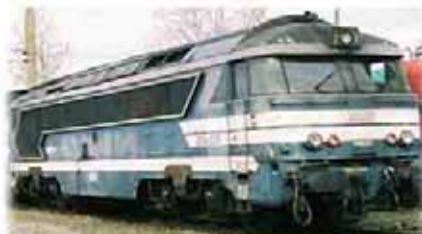
Ref. 86803 n° 68075 logo "allégé" Ref. 86804 n° 68537 logo "allégé"