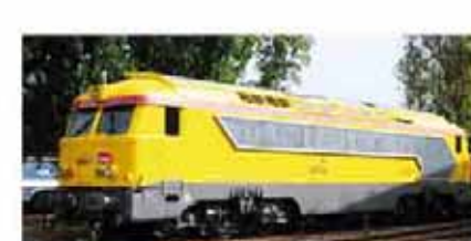
Ref. 86809 INFRA n° 668537 logo "carmillon"