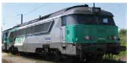
Ref. 86807 FRET n° 668540 logo "carmillon"