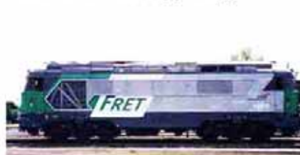
Ref. 86808 FRET n° 468010 logo "casquette"