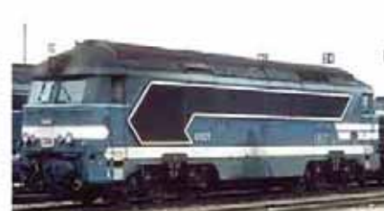
Ref. 86805 n° 68034 logo "à plaque"