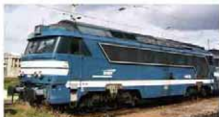
Ref. 86802 n° 668535 logo "casquette"