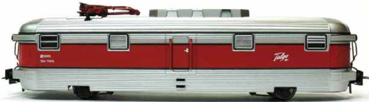
REF. 81112 N° 111014