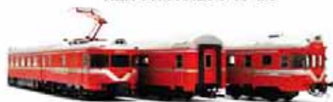
REF. 84322 DC