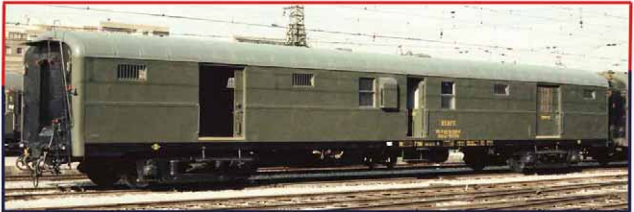
REF. 85002 N° DDT5015