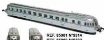
REF. 85901 N°9314 REF. 85902 N°9322 REF. 85903 N°9329 REF. 85904 N°9325