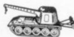
4033 - T-130 - GRUA - USA