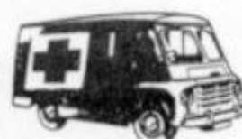
4044 AMBULANCIA SAVA