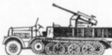
4042 K. M. 8 TON. ANTI-AEREO