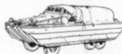
4036 - ANFIBIO 'DUCKW'