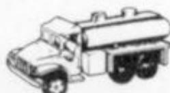
4025 GMC 2.5 L CISTERNA M-35