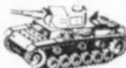
4039 - PANZER III - ALEMANIA