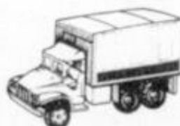
4026 G.M.C. TALLER