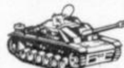
4040 CARRO ASALTO P. III - ALEMANIA