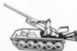
4031 - T-245 - USA