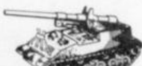
4019 - M-40 U.S.A.