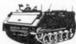
4034 - M-113 - USA