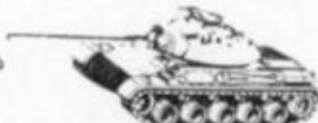
4038 - A.M.X. 30 - FRANCIA