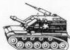
4033 - T-96 - USA