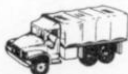
4028 GMC 2.5 L VELA