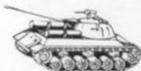
4029 - STALIN - URSS