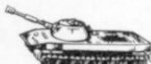
4020 PT - 76