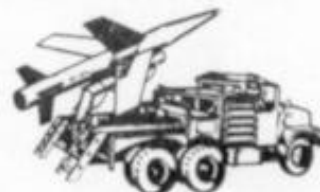
4027 GMC 2.5 L COHETE