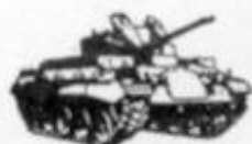
4018 M-42 ANTI-AEREO U.S.A.