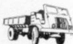
4035 - CAMION BARREIROS T. T. 90.22