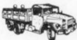
4024 GMC 2.5 L M-35