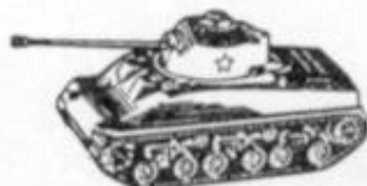
4012 - M-4 - SHERMAN