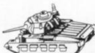
4043 MATILDA Mk II