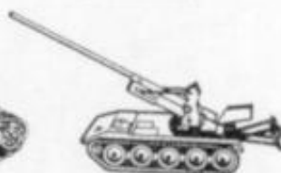
4030 - T-235 - USA