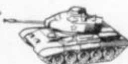
4014 M-41 W. BULLDOG U.S.A.