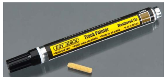
WDTT4580 – ROTULADOR VIAS COLOR METAL WDTT4581- ROTULADOR VIAS COLOR OXIDO WDTT4582 – ROTULADOR VIAS ENVEJECIDO