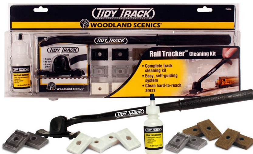
WDTT4550 – KIT LIMPIAVIAS –