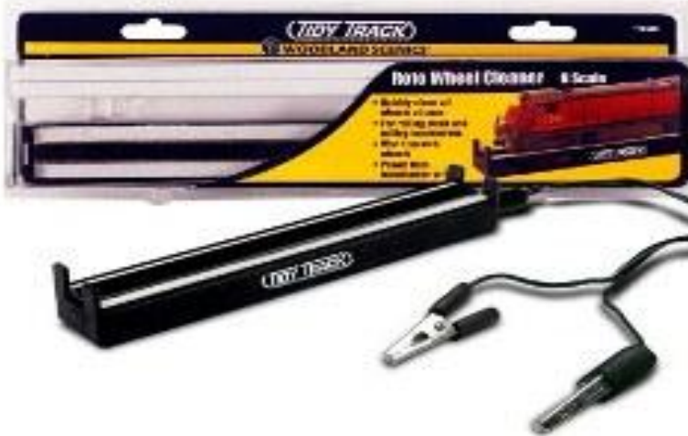
WDTT4560 – LIMPIARUEDAS ELECTRICO ESC.N – WDTT4561 – LIMPIARUEDAS ELECTRICO ESC.HO –