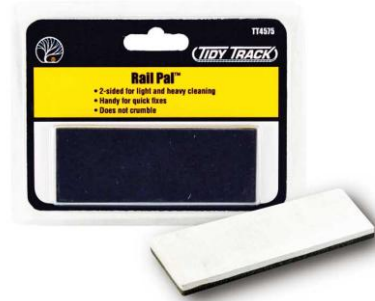
WDTT4575 – LIMPIADOR MANUAL –