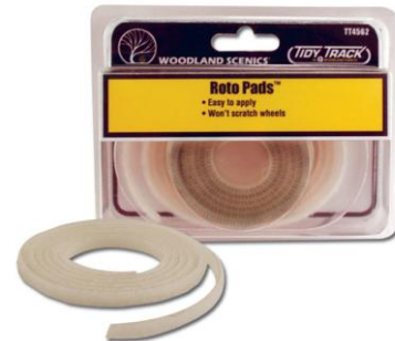
WDTT4562 – RECAMBIO LIMPIARUEDAS ELEC. –