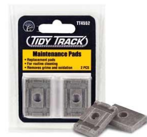
WDTT4552 – RECAMBIO –