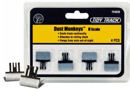
WDTT4570 – LIMPIAVIAS PARA VAGON ESCALA N – WDTT4571 – LIMPIAVIAS PARA VAGON ESCALA HO –