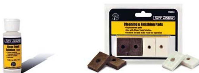
WDTT4553 – RECAMBIO –