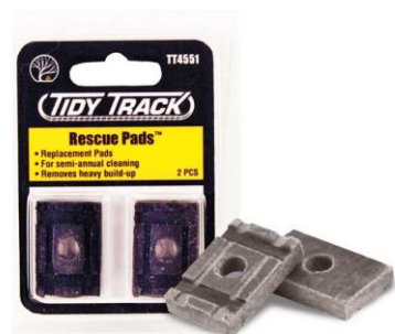
WDTT4551 – RECAMBIO –