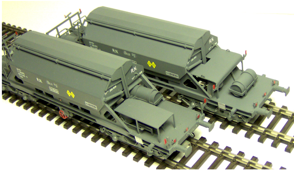
Versiones TT3-H (izquierda) y TT3-G (derecha). Obsérvese la distinta configuración de los equipos de freno.