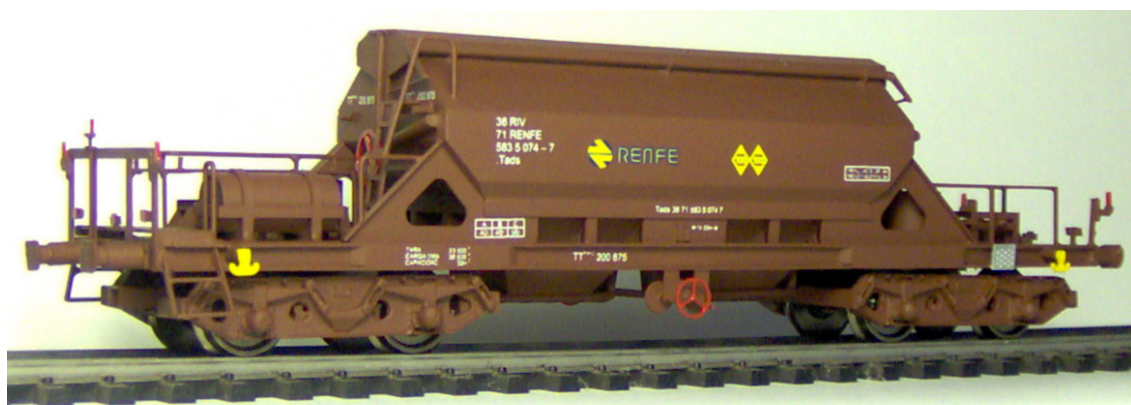
Ref. TT3-J – Rojo óxido - Tads 583 (Época IVa-IVb) – Calderín longitudinal

El modelo a escala 1/87 está construido íntegramente en latón fotograbado y pieciería de fundición. Equipado con ruedas según norma NEM 311 para corriente continua y dotado de mecanismo de elongación con cajetín según norma NEM 362. No se incluyen los enganches. Radio mínimo recomendado 500 mm.