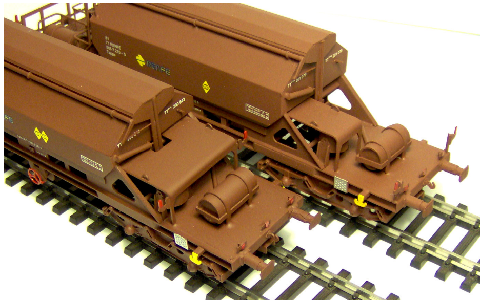
Versiones TT3-I (izquierda), de la primera subserie, y TT3-P (derecha), de la segunda subserie. Nótese la diferencia de altura de la tolva, así como la distinta anchura de la cubierta de los equipos de freno.

El modelo se ofrece en las siguientes 8 versiones.