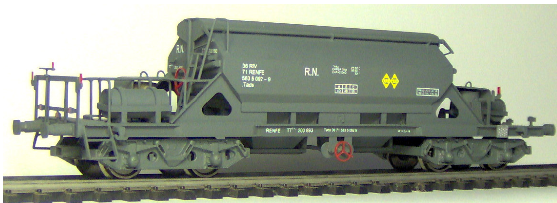
Ref. TT3-G – Gris - Tads 583 (Época IVa) – Calderín transversal

A finales de los años 60, RENFE decide aumentar su parque de vagones tolva para el transporte de minerales, formado hasta entonces por 650 tolvas Werkspoor de la serie TT 200.001 a TT 200.750 y algunas decenas de tolvas Nelson y Motherwell heredadas de Andaluces y del Lorca-Baza-Águilas. A consecuencia de ello, se reciben en 1968 un total de 110 tolvas construidas según un proyecto de Krupp. Dotadas de bogies ORE, con una tara de 23.500 kg, una carga máxima de 56.500 kg y una capacidad de 32 m 3 , cien de ellas disponen de una cubierta basculante que permite evitar la pérdida de la carga y la humidificación de la misma por causa de la lluvia. En esta serie existen diferencias en la configuración de los equipos de freno y en el diseño de las cubiertas de protección de los mismos, en función del fabricante que las suministró. Fueron matriculadas como TT 200.801 a TT 200.900 y pintadas en el color gris habitual de la época. En 1971 reciben la matriculación UIC y durante esa década son progresivamente repintadas en rojo-óxido.