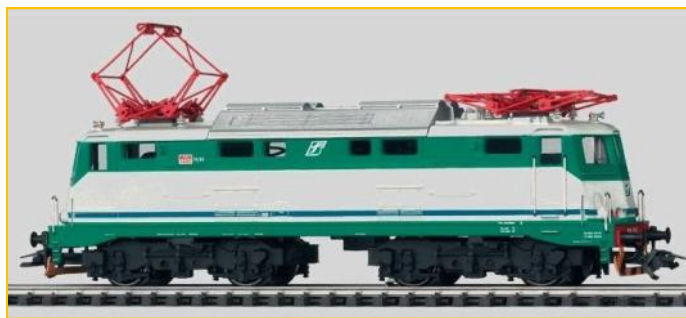
MARKLIN HO. Ref. 37242. Locomotora E424 de los ferrocarriles italianos FS. PVP=119.90€