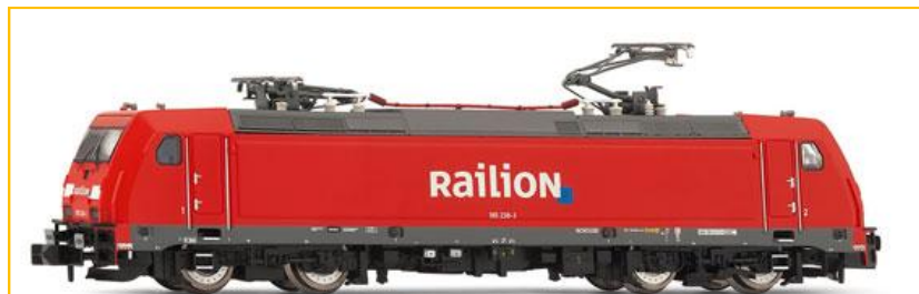
ARNOLD N. Ref. HN2105 Locomotora br185 "Railion" PVP=154.90€