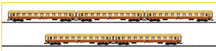
TRIX N. Ref. 15883. Composición de 5 coches "Y" de la DR con decoración "Städteexpress" PVP=119.90€