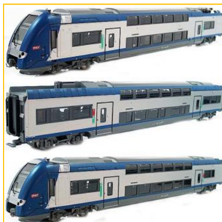
JOUEF HO. Ref. HJ2121. Automotor SNCF Z24703. PVP=279.90€