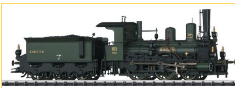
TRIX HO 22188. Locomotora B VI de la K.Bay.Sts.B "Steinach". Totalmente metálica y digitalizada, con múltiples funciones de sonido. PVP=334.90€