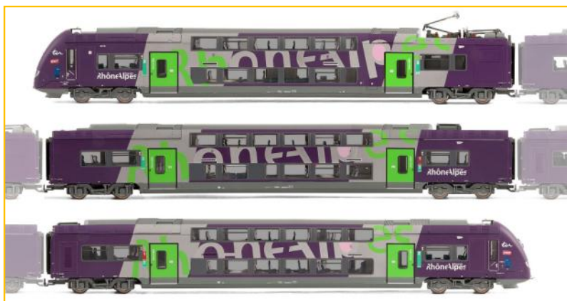
JOUEF HO. Ref. HJ2121. Automotor SNCF Z24613. "Rhône-Alpes". PVP=279.90€