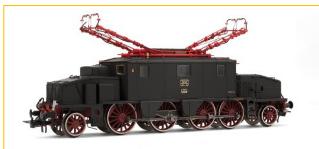
RIVAROSSI HO. Locomotora FS Trifase E431.

Versión digital con sonido 2 carriles. Ref. HR2243. PVP=339.90€