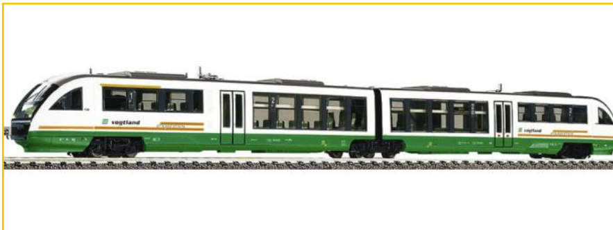
FLEISCHMANN N. Ref. 742074 Automotor diesel "Desiro" Vogtld. Versión digital con decoder con múltiples funciones de sonido de gran calidad. PVP=299,90€.