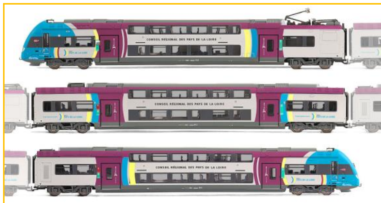
JOUEF HO. Ref. HJ2120. Automotor SNCF Z24691. "Pays de la Loire". PVP=279.90€