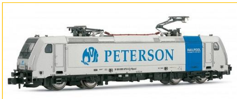
ARNOLD N. Ref. HN2137. Locomotora br185 RailPool / Peterson Rail PVP=154.90€