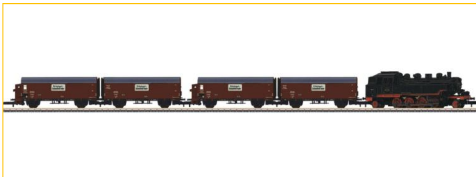
MARKLIN Z. Ref. 81001. Composición DRG compuesta por locomotora BR86 y 2 parejas de vagones tipo "Leig". Serie única . PVP=239,90€.