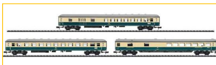
TRIX N. Ref. 15880. Complemento de 3 coches DB para Ref. 15879 PVP=64,90 €