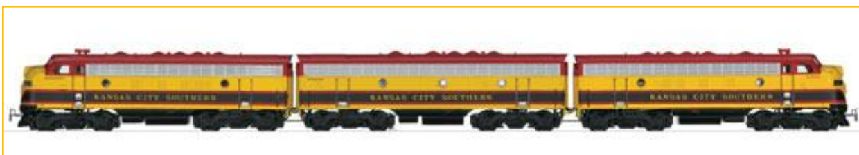
MARKLIN HO. Ref. 37628. Locomotora triple –2 unidades motorizadas– tipo EMD F7 de “Kansas City Southern”. Serie Única 2012. PVP=429.90€