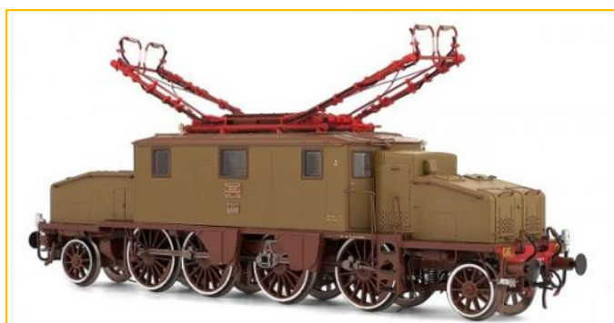
RIVAROSSI HO. Locomotora FS Trifase E431.

Versión analógica 2 carriles. Ref. HR2242. PVP=229.90€