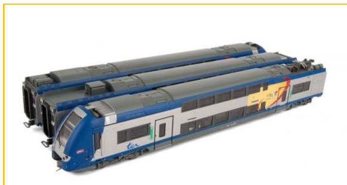
JOUEF HO. Ref. HJ2122. Automotor SNCF Z24503. "Lorraine". PVP=279.90€