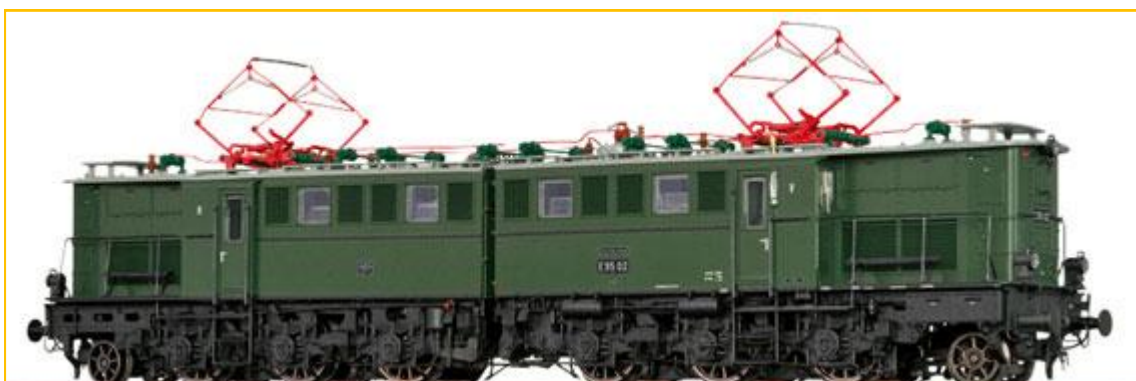
BRAWA HO. Ref. 43028. Locomotora E95 DR. Versión museo . PVP=279.90€