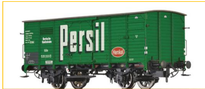
BRAWA HO. Ref. 48259. Vagón cerrado tipo G10 de DRG. “Persil”. PVP=32.90€