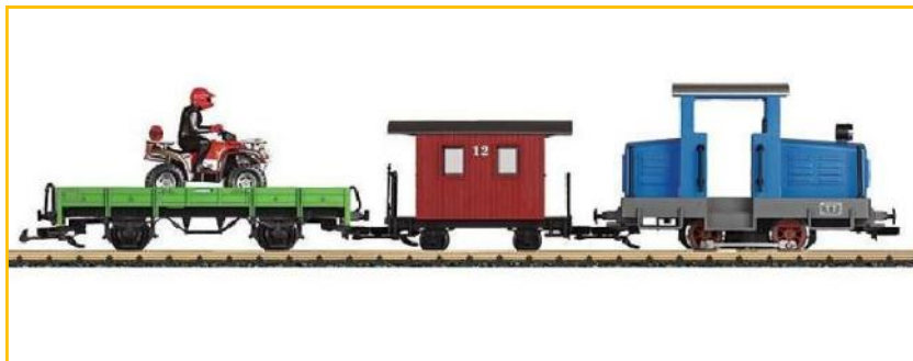
LGB "G". Ref. 90450. Nueva caja iniciación completa gama "ToyTrain". Locomotora con iluminación , transformador y circuito de 1.2m de diámetro PVP=219.90€