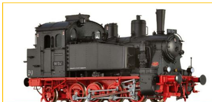
BRAWA HO. Ref. 40556. Locomotora BR98.10 DB. Digital sonido 2 carriles PVP=369.90€