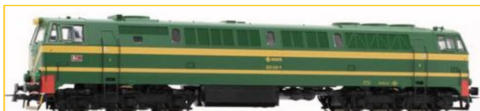
ROCO HO. Ref. 62730. Locomotora Renfe s/333 en color verde. Modelo con foco de doble óptica. Disponible también la óptica de foco único. Disponible PVP=173.90€