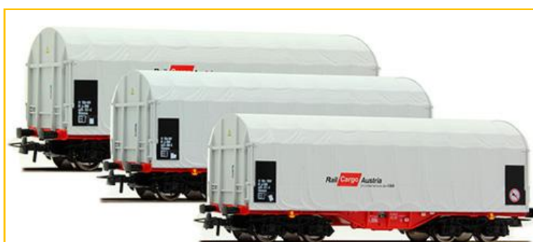
ROCO HO. Ref. 67037. Composición 3 vagones porta-bobinas con lona de la compañía ÖBB. PVP= 71.50€