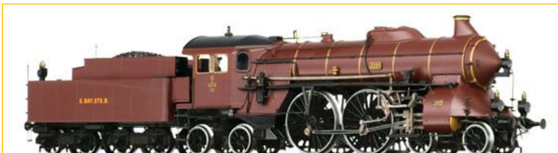
BRAWA HO. Ref. 40264 Locomotora S 2/6. K.Bay.Sts.B.. Digital y sonido 2 carriles PVP=575.50€