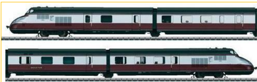
MARKLIN HO. Ref. 39101. Tren VT 10.5 DB “Senator”. Motor “Sinus”, totalmente metálico, iluminación interior y dotado de múltiples funciones de sonido. PVP=468.90€