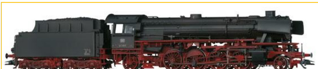
MARKLIN HO. Ref. 37922. Locomotora vapor DB BR41. Molde totalmente nuevo, metálica, digital con múltiples funciones de sonido. Serie única MHI. Disponibles pocas unidades.