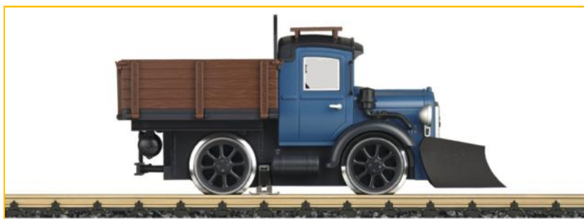
LGB "G". Ref. 24680 Camión motorizado con pala quitanieves. PVP=254.90€