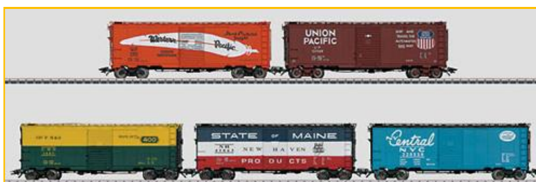
MARKLIN HO. Ref. 45653. Conjunto 5 vagones “Box Car” de varias compañías americanas. PVP=155.90€