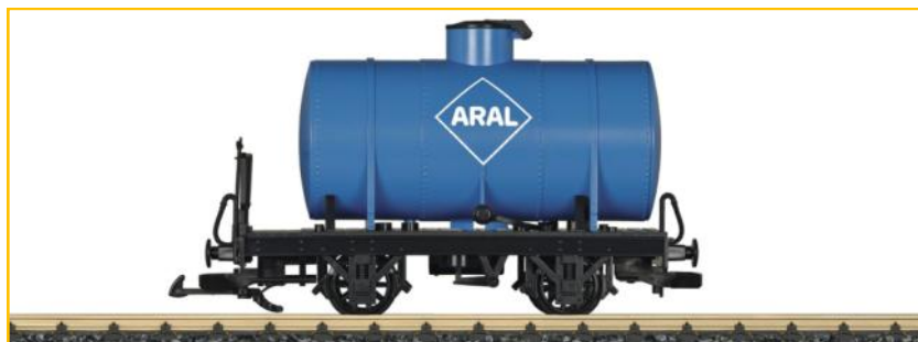
LGB "G". Ref. 94580 Cisterna "Aral". Gama hobby "Toy Train". PVP=39.90€