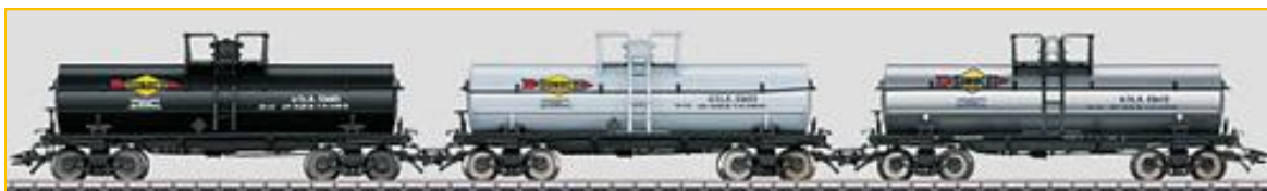
MARKLIN HO. Ref. 45656 Conjunto 3 vagones cisterna para transporte de combustibles, de la compañía americana "Sunoco". PVP=93.90€