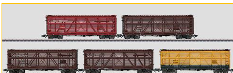
MARKLIN HO. Ref. 45655 Conjunto 5 vagones tipo jaula para transporte de ganado, de varias compañías americanas. PVP=155.90€