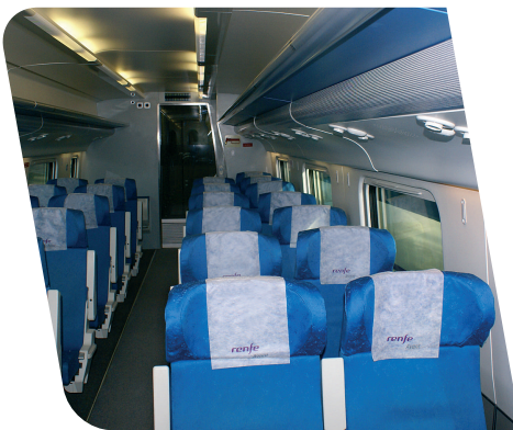
Megafonía a bordo