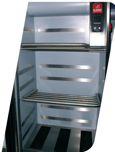
Maleteros independientes en vestíbulos