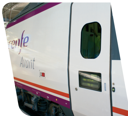
Puertas exteriores automáticas