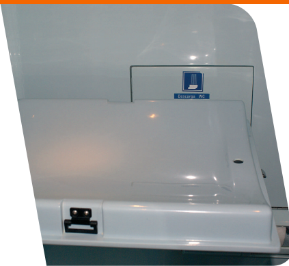
Espacio para cambio de pañales