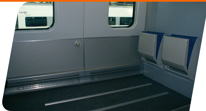
Espacio para persona con movilidad reducida