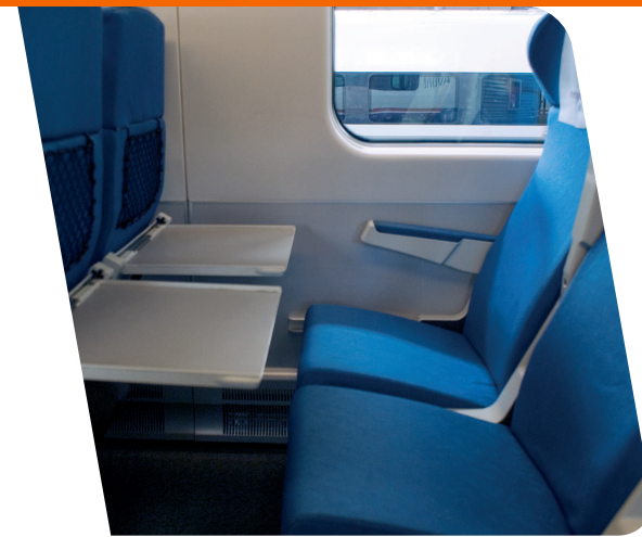
Mesa abatible en cada asiento