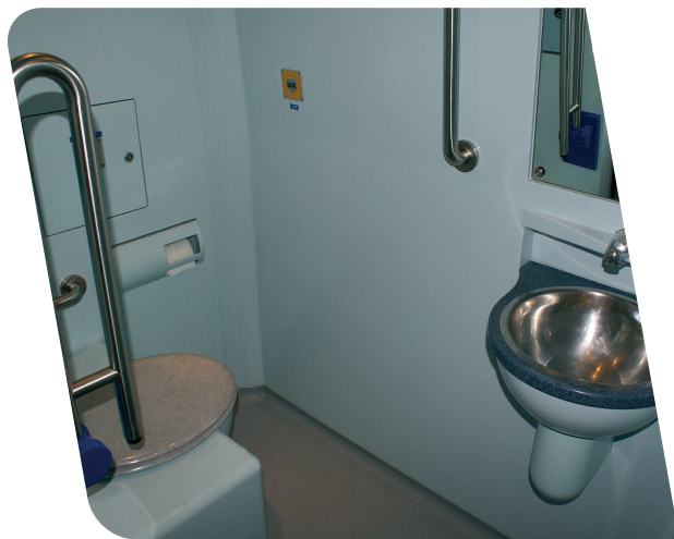
Aseo adaptado para personas con movilidad reducida