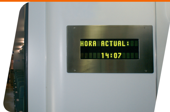
Información mediante teleindicadores