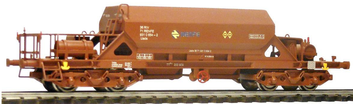
Ref. TT2-P – Rojo óxido - Uads 931 (Época IVa-IVb)

El modelo a escala 1/87 está construido íntegramente en latón fotograbado y piecería de fundición. Equipado con ruedas según norma NEM 311 para corriente continua y dotado de mecanismo de elongación con cajetín según norma NEM 362. No se incluyen los enganches. Radio mínimo recomendado 500 mm.