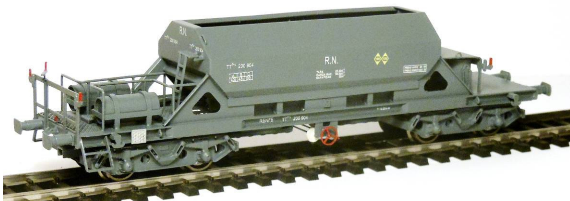
Ref. TT2-M – Gris pre-UIC (Época IIIb) – Equipos de freno de origen

A finales de los años 60, RENFE decide aumentar su parque de vagones tolva para el transporte de minerales, formado hasta entonces por 650 tolvas Werkspoor de la serie TT 200.001 a TT 200.750 y algunas decenas de tolvas Nelson y Motherwell heredadas de Andaluces y del Lorca-Baza-Águilas. A consecuencia de ello, se reciben en 1968 un total de 110 tolvas construidas según un proyecto de Krupp. Dotadas de bogies ORE, con una tara de 23.500 kg, una carga máxima de 56.500 kg y una capacidad de 32 m 3 , diez de ellas carecen de cubierta superior. Originalmente disponían de dos depósitos de reserva de vacío en el extremo con balconcillo y dos cilindros de freno de vacío en el extremo opuesto. Esta disposición no ofreció un funcionamiento satisfactorio y muy pronto fué modificada, permutando la posición de un depósito y de un cilindro de freno. Fueron matriculadas como TT 200.901 a TT 200.910 y pintadas en el color gris habitual de la época. En 1971 reciben la matriculación UIC y durante esa década son progresivamente repintadas en rojo-óxido.