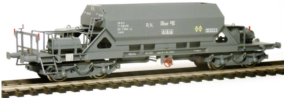
Ref. TT2-O – Gris – Uads 931 (Época IVa)