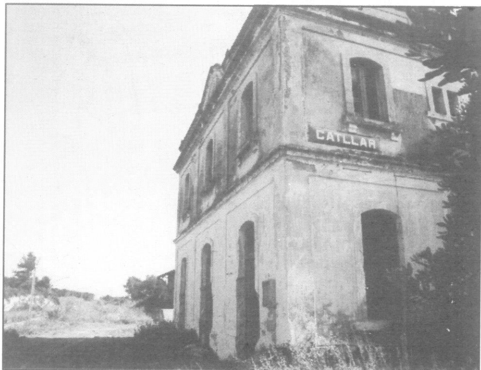
Apeadero de El Catllar.