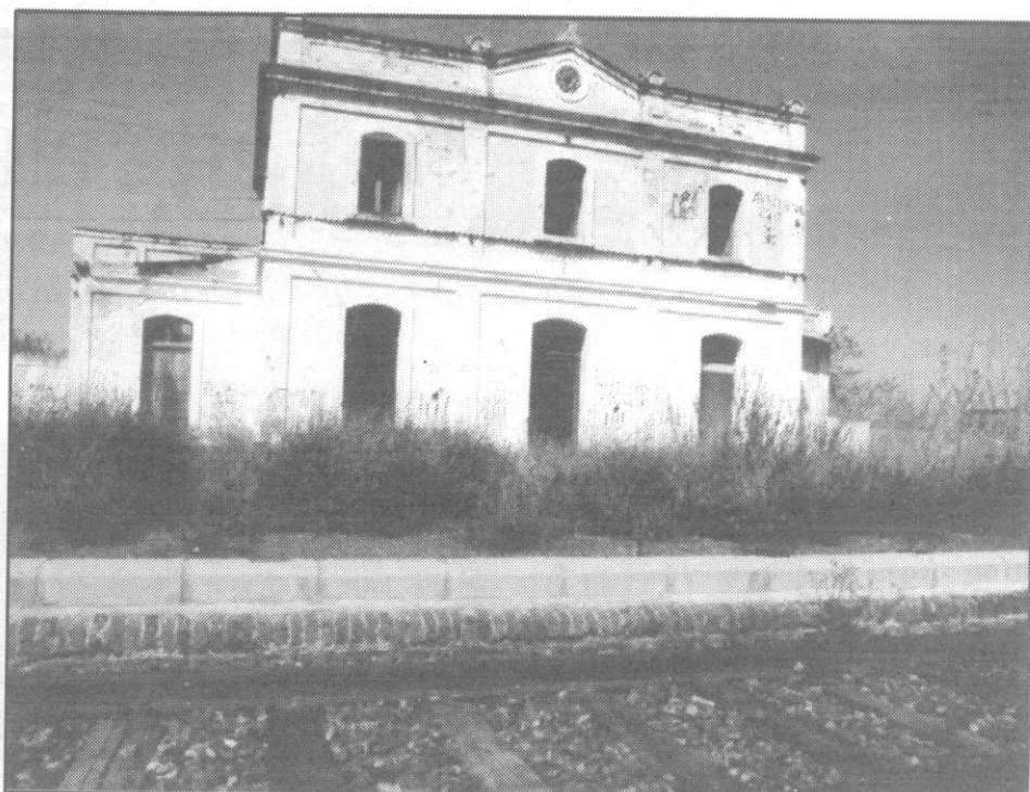
Apeadero de La Secuita-Perafort.