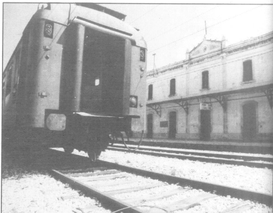
Apeadero de Roda de Barà-Bonastre.