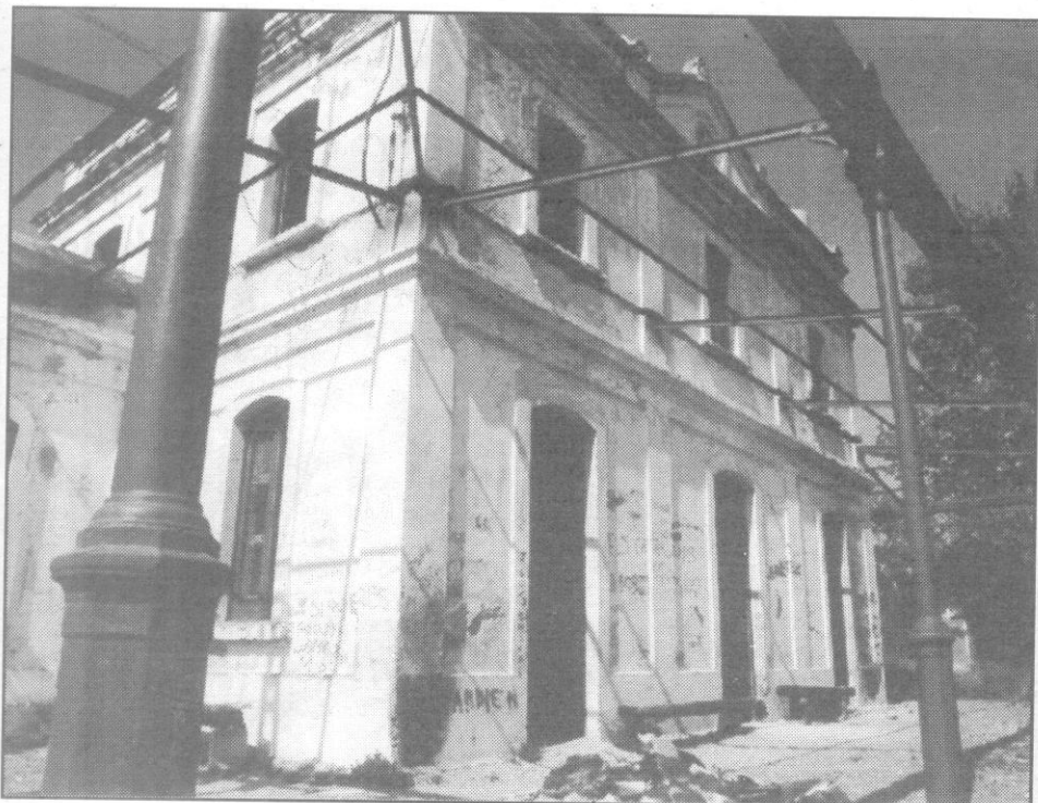
Apeadero de El Morell-La Pobla de Mafumet.