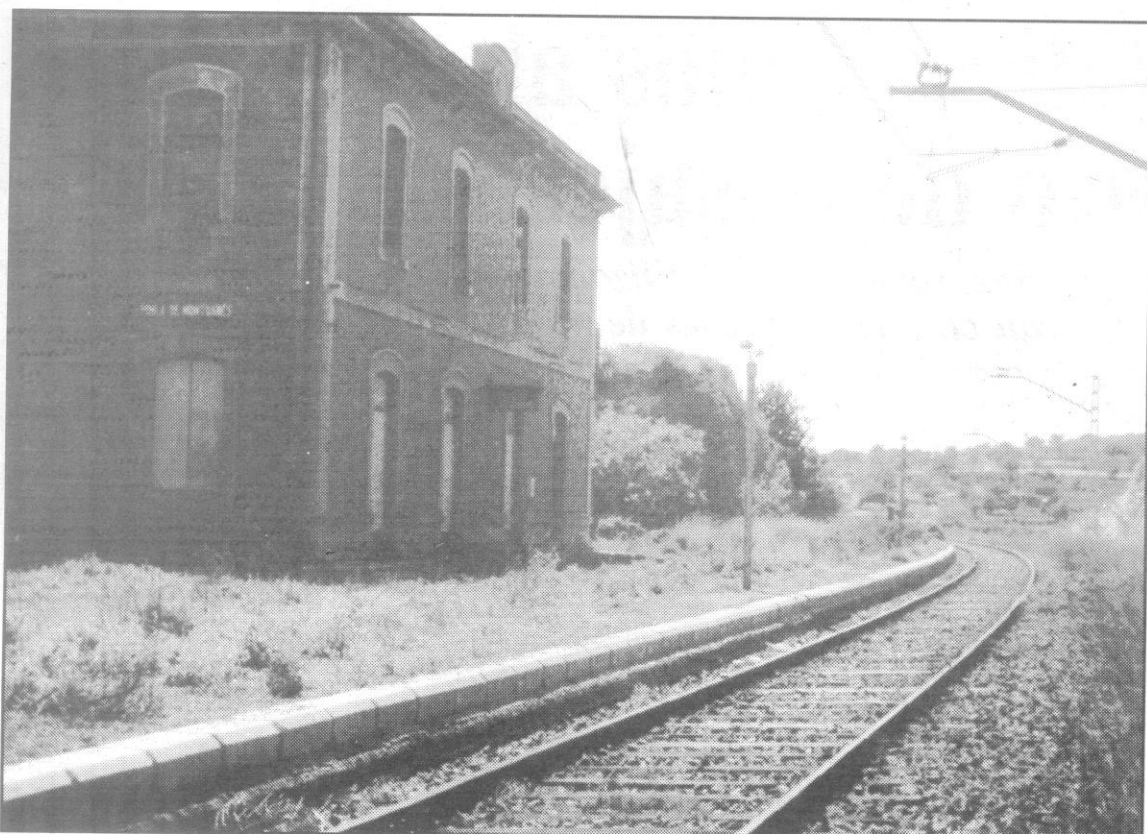
Apeadero de La Riera de Gaià-La Nou de Gaià.