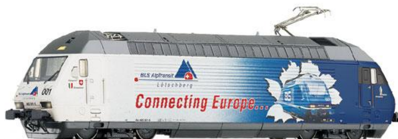
FLEISCHMANN N .Locomotora BLS serie 465.