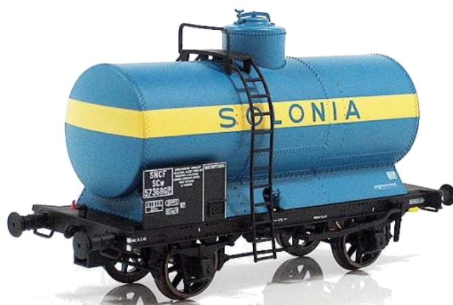
REE HO .Ref. WB-159. Cisterna OCEM "Solonia" . PVP=29.90€