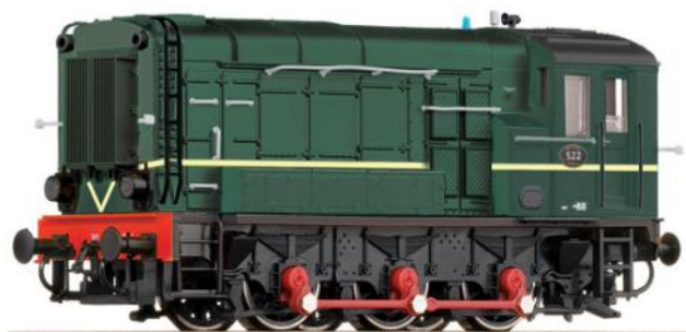
ROCO HO .Ref. 72731. Locomotora de los ferrocarriles holandeses NS Serie 600. PVP=89.90€