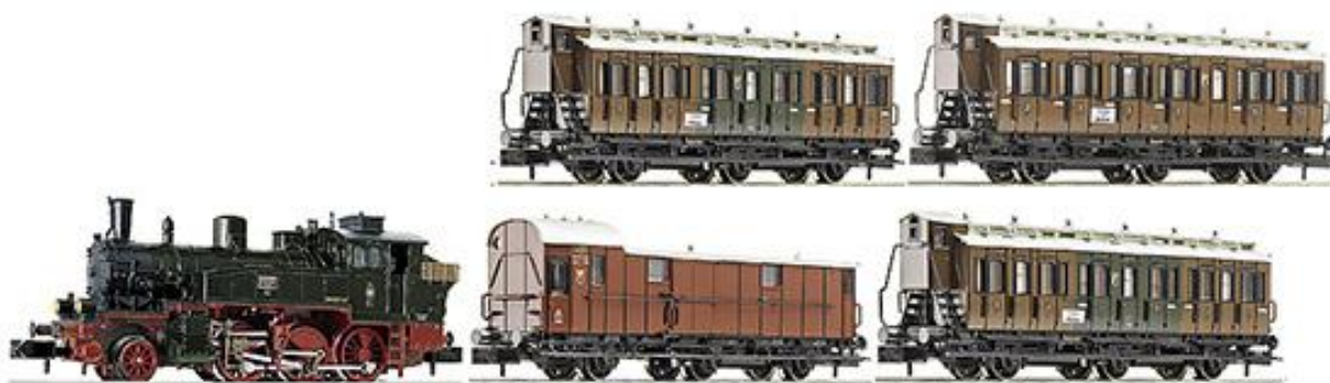
FLEISCHMANN N .Ref. 781202. Conjunto de la KPEV. PVP=224.90€