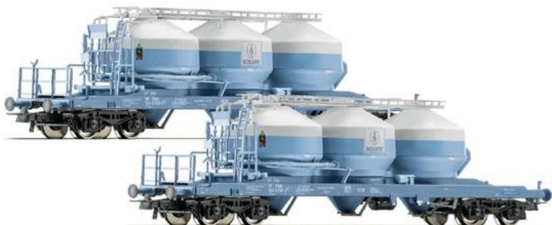
ROCO HO .Ref. 67011. Pareja de tolvas tipo Uacs para cemento "Solvay" de la ÖBB. PVP=89.90€