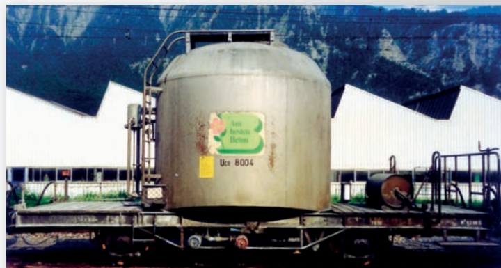
9452 114 Uce 8004 silber mit grünem B