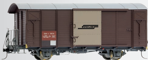
9482 114 Gbk-v 5574 braun