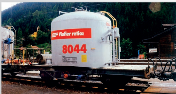
9452 134 Uce 8044 mit rotem Band