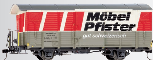
9482 123 Gbk-v 5613 Werbewagen „Möbel Pfister“