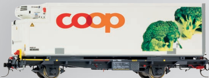
9469 115 Lb-v 7885 mit WAB 27 „Coop“ (Broccoli)