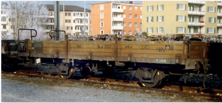
9463 107 Kk-w 7337 Niederbordwagen mit Aluwänden