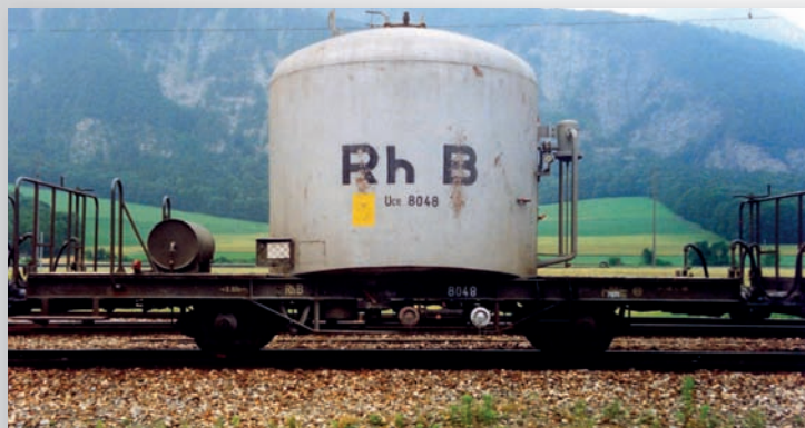
9452 118 Uce 8048 silber