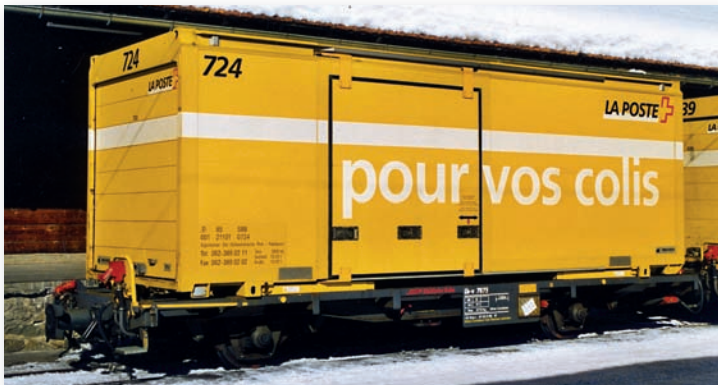
9469 105 Lb-v 7875 mit Postcontainer 724 „pour vos colis“