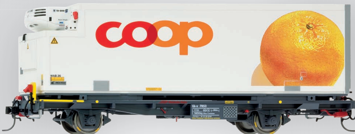
9469 113 Lb-v 7853 mit WAB 26 „Coop“ (Orange)