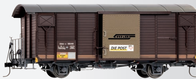
9482 116 Gbk-v 5546 für Postverkehr