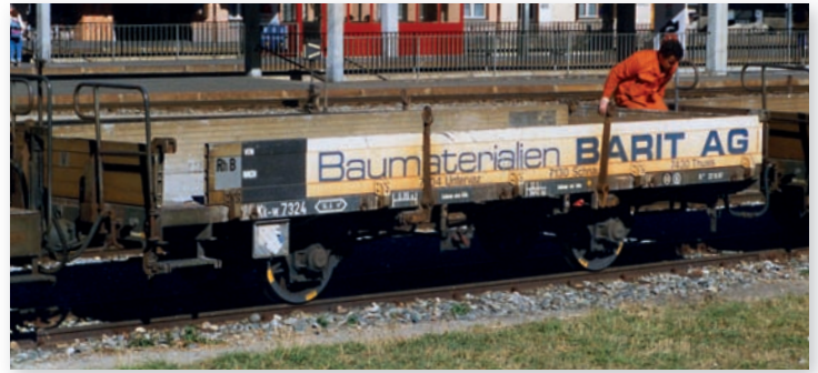
9463 124 Kk-w 7324 Niederbordwagen „BARIT AG“