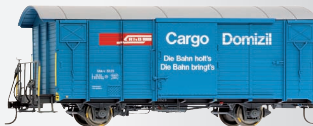
9482 125 Gbk-v 5525 Werbewagen „Cargo Domizil“