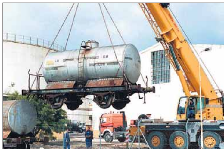
Operación de traslado a talleres de una de las cisternas de Azucarera Ebro