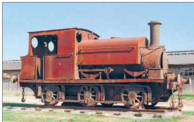
La locomotora Azucarera de Castilla en Francia, a la espera de repatriación