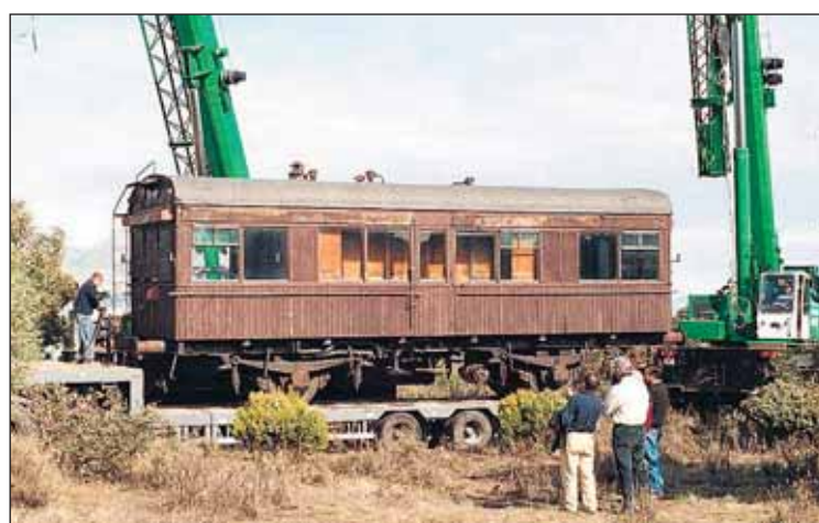
Traslado a talleres del coche-salón de la antigua Compañía de Ferrocarriles del Oeste