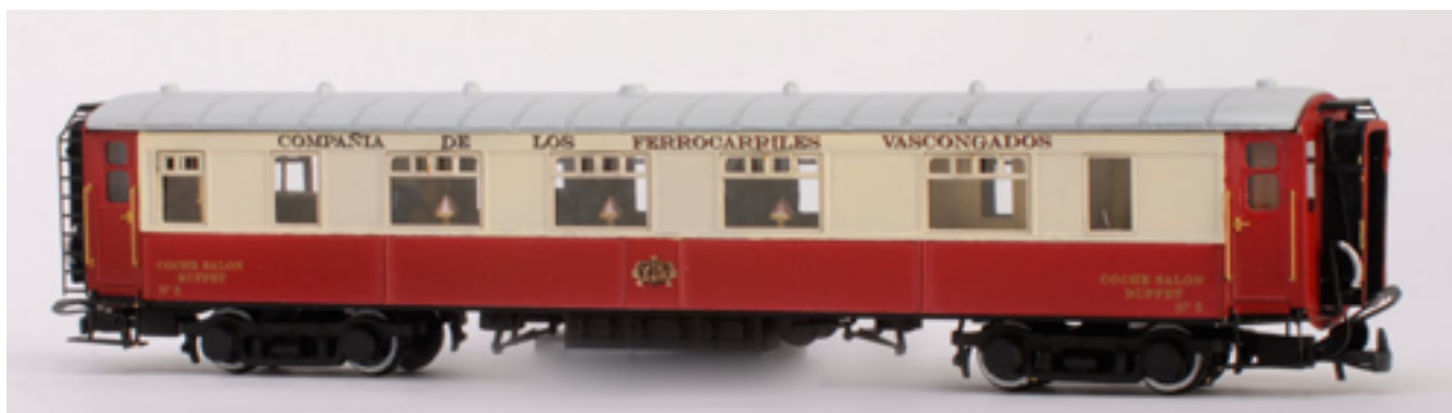
Coche Salón Buffet

Los interesados enviar un mensaje a 242CONFEE. Se atenderán los pedidos por riguroso orden de llegada.