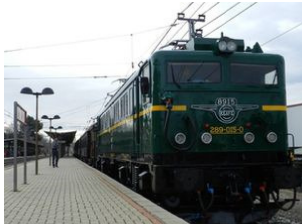
Locomotora eléctrica 289-015, que este año encabeza el Tren de la Fresa

Más de 160.000 pasajeros han viajado a bordo de los históricos coches de madera de Tren de la Fresa desde que en 1984 se promoviera la idea de rememorar el recorrido del que fue el primer ferrocarril de Madrid y el segundo de la Península. Hoy el recorrido se ha transformado en un atractivo viaje en tren al que se suman la riqueza arquitectónica, artística, paisajística, cultural y gastronómica del Real Sitio de Aranjuez, una ciudad que conserva todo el sabor y esplendor de su regia historia.