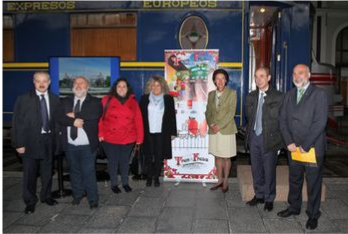
Rueda de prensa de presentación en el Museo, celebrada el 20 de abril

También se ha añadido a la composición un coche de viajeros de segunda clase que forma parte de una de las primeras series de coches metálicos encargados por Renfe entre 1947 y 1953. La composición del tren la completan los tradicionales cuatro coches de madera denominados 'Costa', contruidos entre 1914 y 1930, que cubrían los servicios de cercanías de la compañía MZA (Madrid-Zaragoza-Alicante), un furgón y un vagón de los años 60.