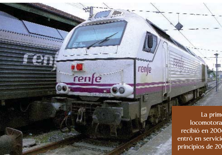
La primera locomotora se recibió en 2006 y entró en servicio a principios de 2007.

Tras realizar una revisión de los relés, fusibles y sistemas principales de la máquina para comprobar su buen estado, se procede a conectar las baterías de alimentación a 64 voltios, cuya caja se encuentra en la parte inferior del bastidor de la locomotora. Acto seguido se activan los sistemas de engrase del turbo del motor diésel durante un tiempo de aproximadamente dos minutos, tras el cual, desde el mando