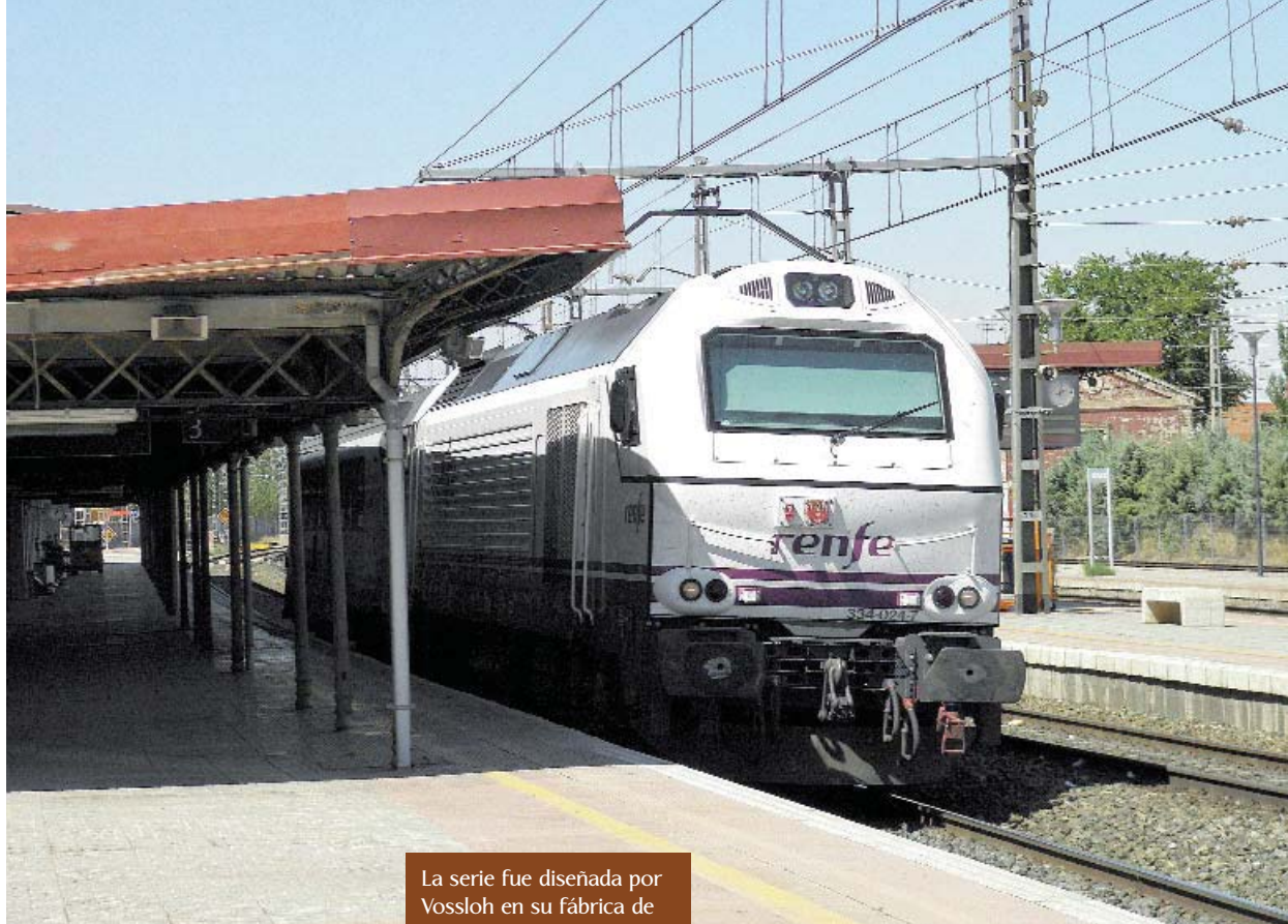
La serie fue diseñada por Vossloh en su fábrica de Albuixech.

Diésel –GM EMD– y del modelo 12N 710G3B que proporciona 3050 caballos a 926 rpm, siendo la velocidad al ralentí del motor de 269 rpm.