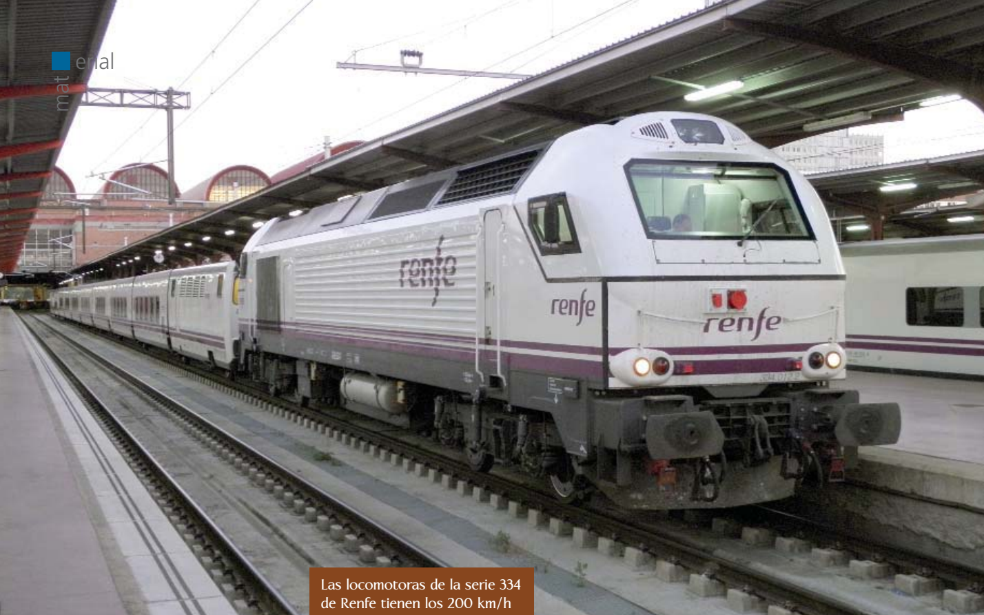
Las locomotoras de la serie 334 de Renfe tienen los 200 km/h como velocidad máxima.

ción, comenzaron sus servicios comerciales remolcando los Talgo en la relación Madrid/Murcia/Cartagena vía Albacete a comienzos de 2007, sustituyendo a las 333.4 que les cubrían en ese trayecto hasta su llegada. Posteriormente, con la recepción de las siguientes máquinas de la serie, comenzaron a relevar las pocas 319.300 que quedaban en servicio de viajeros –y que fueron a Mercancías o vendidas a otros países como Argentina– en los servicios Altaria que unían Madrid con Granada y Almería.