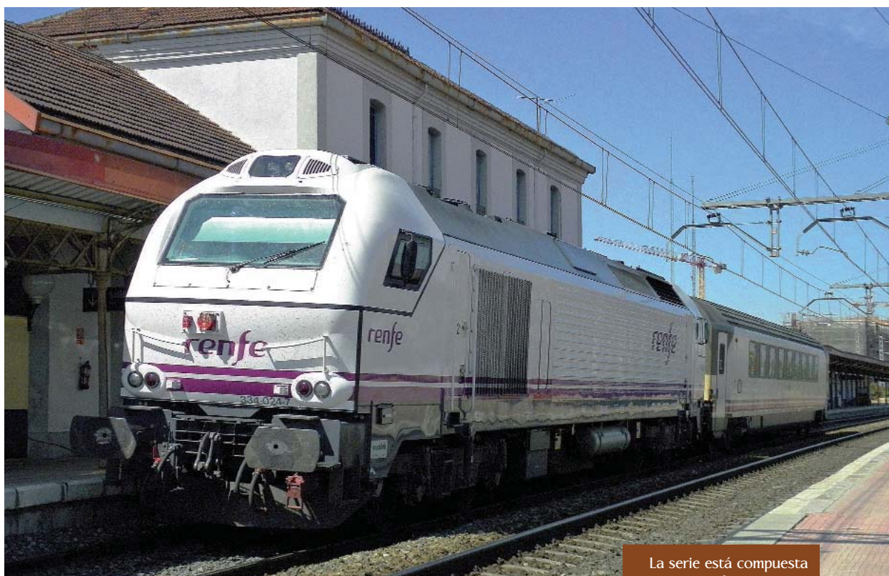
La serie está compuesta por 28 locomotoras.

de cebado y arranque del motor diésel situado al lado del mismo, se gira primero hacia la posición “cebado”, con lo que se consigue que circule gasoil por todo el circuito de admisión del motor.