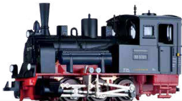
ÜBERARBEITUNG: Dampflok BR 99.57 der DR NEW: Steam locomotive class 99.57 of the DR