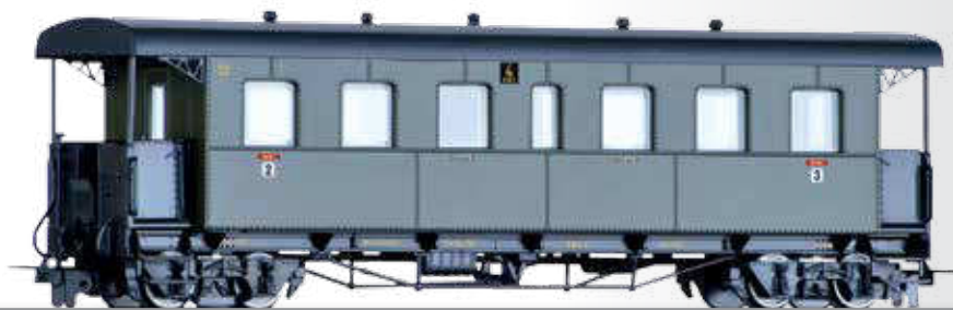
Personenwagen BC4i der NWE (Nordhausen-Wernigeroder Eisenbahn-Gesellschaft) Passenger coach BC4i of the NWE (Nordhausen-Wernigeroder Eisenbahn-Gesellschaft)