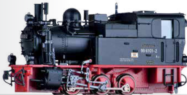
Dampflokomotive 99 6101-2 der DR Steam locomotive 99 6101-2 of the DR