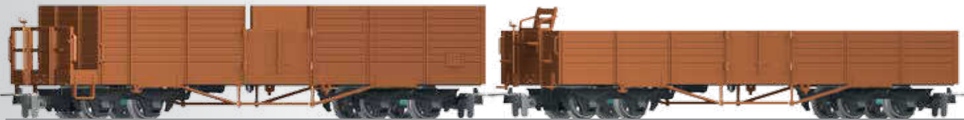
FORMNEUHEIT: Güterwagenset der DR, bestehend aus zwei offenen Güterwagen OO NEW: Freight car set of the DR with two open cars OO