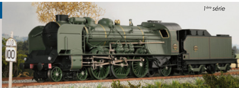
1 ère série

HO-MX.001/6 SNCF 1-231 G 265 , tender 37 A 60, Nancy, noir HO-MX.001/7 SNCF 2-231 G 140 , tender 37 A 97, vert et noir HO-MX.001/8 PLM 231 H 141 , tender 30 - 367