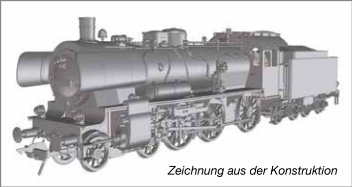
Zeichnung aus der Konstruktion

Die preußische P 8 gilt als eine der genialen Konstruktionen mit Heißdampf-Triebwerk des preußischen Lokomotiv-Beschaffungs-Dezernenten Robert Garbe.