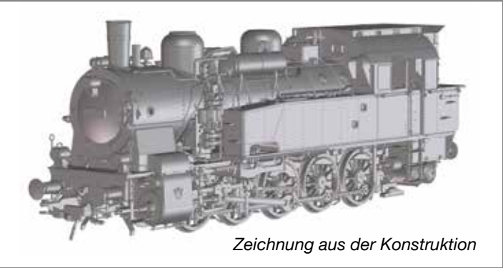
Zeichnung aus der Konstruktion

Zwischen 1913 und 1924 wurde die preußische T 16.1 gebaut. Von den insgesamt 1.236 Stück der 1.070 PS starken Lok sind heute noch 10 Stück erhalten, betriebsfähig ist derzeit keine.