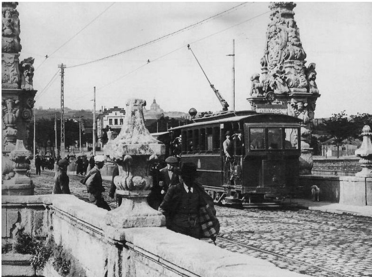
Tranvía a Carabanchel. Año 1915