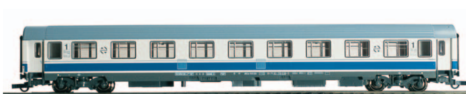
Coche de viajeros 1ª clase A10x-10036 Largo Recorrido. Longitud 303 mm.