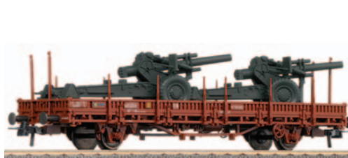
Vagón plataforma de 2 ejes con dos cañones de 105 mm. Longitud 138 mm.