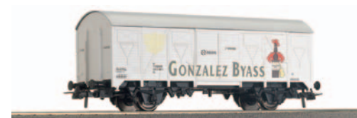
Vagón cerrado de 2 ejes ORE J2 Gonzalez Byass. Longitud 122 mm.