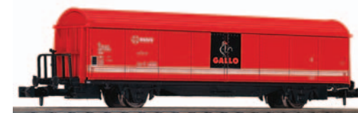
Vagón cerrado de 2 ejes Hbis. Pastas Gallo. Longitud 88 mm.