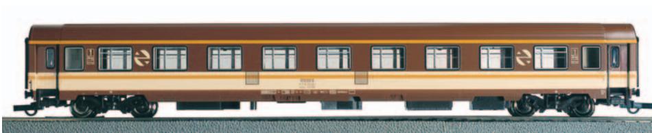
Coche de viajeros 1ª clase A10x-10036 Estrella. Longitud 303 mm.