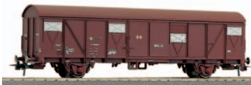
Vagón cerrado de 2 ejes ORE J1 serie J 600.001/625. Longitud 161 mm.