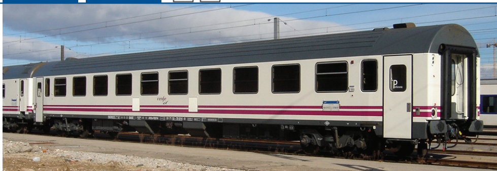
Coche de viajeros clase Preferente A10x-10000 y coche de viajeros clase Turista Bc10x-10000 RENFE Explotadora. Longitud: 264 mm.