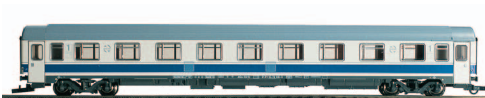
Coche de viajeros 1ª clase A10x-10004 UNE Largo Recorrido. Longitud 303 mm.