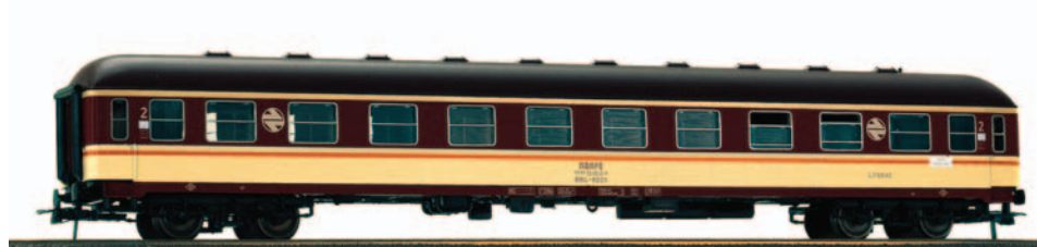
Coche de viajeros Estrella Literas 2ª clase BBL 8124. Longitud 264 mm.