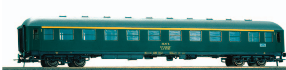
Coche de viajeros 1ª clase AA 8033. Longitud 264 mm.