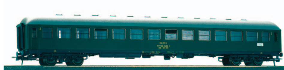
Coche de viajeros 2ª clase BB 8578. Longitud 264 mm.