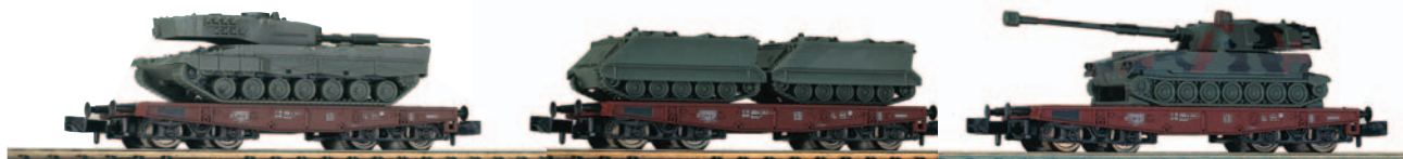
Surtido de 12 vagones militares militares de modelos diferentes.