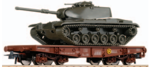
Vagón plataforma transportes especiales de bogies tipo PMM con un carro M 60A3 de la D.A. Brunete nº 1. Longitud 189 mm.