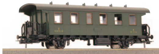
Coche viajeros 2ª clase para trenes ligeros. Longitud 138 mm.