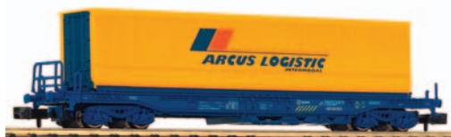
Vagón portacontenedores tipo Sddkkmss con una caja móvil de 40 pies Arcus Logistic. Azul. Longitud 102 mm.