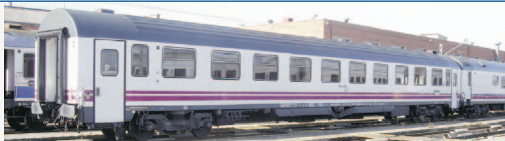
Coche de viajeros clase Preferente A 10x-10000 y coche de viajeros clase Turista Bc 10x-10000 nuevos colores RENFE Operadora. Longitud 165 mm.