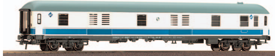
Furgón de paquetería UNE Largo Recorrido serie D8 8000. Longitud 264 mm.