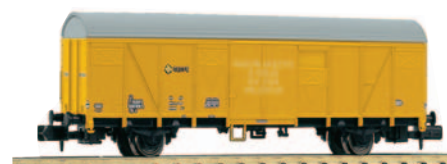
Vagón de acompañamiento de grúa. Longitud 88 mm.