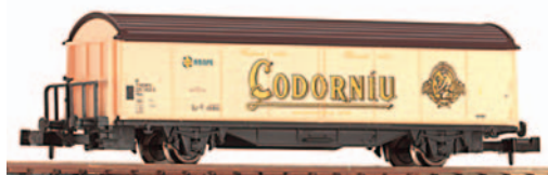
Vagón cerrado de 2 ejes Hbis. Codorniu. Longitud 88 mm.