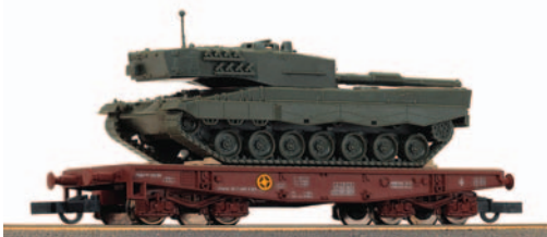
Vagón plataforma transportes especiales de bogies tipo PMM con un carro de combate Leopard 2 de la D.A. Brunete nº 1. Longitud 124 mm.