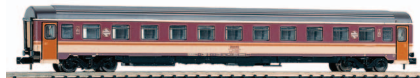
Coche de viajeros Estrella 2ª clase serie BB-10200. Longitud 165 mm.