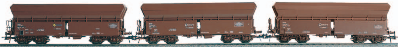
Tres set de 3 vagones tolva de bogies TT 202.000, con matrículas diferentes. Longitud 111 mm x 3 cada set.