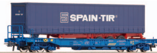
Vagón portacontenedores tipo Sdgkkmss con Remolque Kanguro Spain-TIR. Longitud 189 mm.