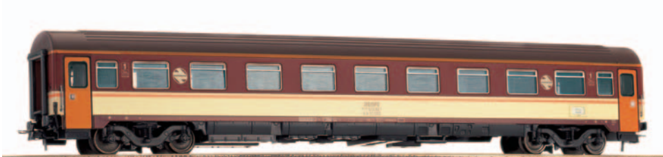
Coche de viajeros 1ª clase serie AA-10.000 Estrella. Longitud 264 mm.