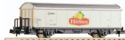
Vagón cerrado de 2 ejes Hbis. Helios. Longitud 88 mm.