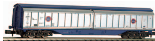
Vagón cerrado de paredes deslizantes tipo Habfís TRANSFESA matriculado en Inglaterra. Long 126 mm.