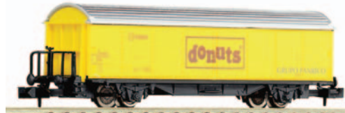
Vagón cerrado de 2 ejes Hbis. Donuts. Longitud 88 mm.