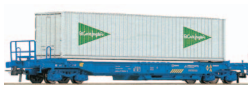
Vagón portacontenedores tipo Sddkkmss con una caja móvil de 40 pies El Corte Inglés. azul. Longitud 189 mm.