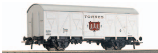
Vagón cerrado de 2 ejes ORE J2 Torres. Longitud 122 mm.