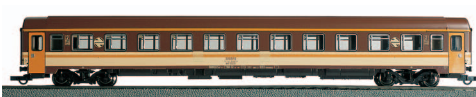
Coche 2ª clase BB-10220 Estrella. Longitud 303 mm.