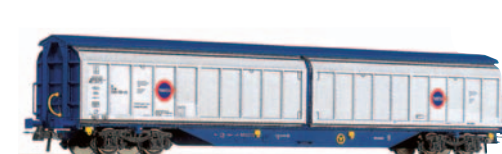
Vagón cerrado de paredes deslizantes tipo Habfis TRANSFESA matriculado en Inglaterra. Longitud 267 mm.