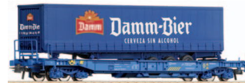
Vagón portacontenedores tipo Sddkkmss con una caja móvil de 40 pies Damm Bier. Longitud 189 mm.