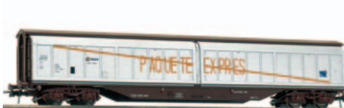
Vagón cerrado de paredes deslizantes JJPD Paquete Expres. Longitud 267 mm.