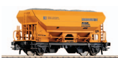
Vagón tolva de 2 ejes Guinovart. Longitud 111 mm.