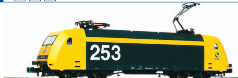
Locomotora eléctrica con decoración RENFE. Carrocería de plástico, bastidor metálico, tracción a los 4 ejes y 2 ruedas provistas de aros de adherencia. Longitud 118,5 mm.