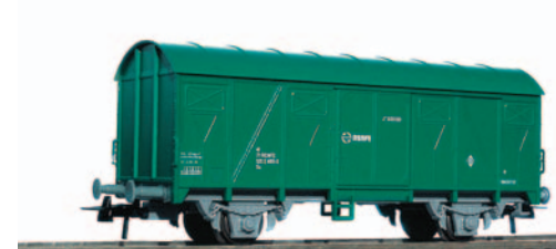
Vagón plataforma de teleros de 2 ejes con caja móvil. Longitud 138 mm.