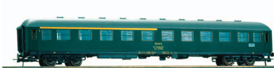
Coche de viajeros mixto 1ª/2ª clase AAB 8005. Longitud 264 mm.