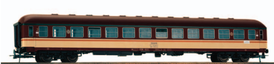
Coche de viajeros Estrella 2ª clase serie B 12x. Longitud 264 mm.