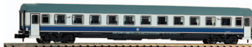
Coche de viajeros 2ª clase serie B11x 10200 UNE Grandes Líneas. Longitud 165 mm.