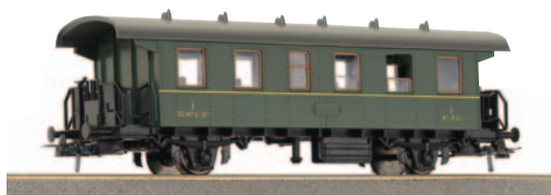
Coche viajeros 1ª clase para trenes ligeros. Longitud 138 mm.