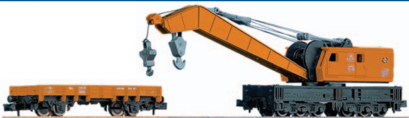
Grúa de emergencia con vagón plataforma de acompañamiento. Longitud 116 mm + 67 mm.