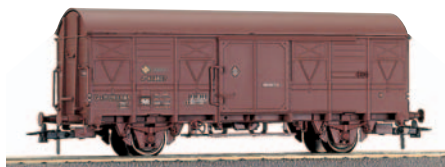
Vagón cerrado de 2 ejes ORE J2 serie J 402.600/409.899. Longitud 122 mm.