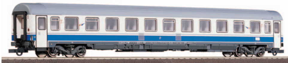
Coche de viajeros clase Turista B11x-10275 UNE Grandes Líneas. Longitud: 303 mm.