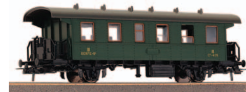
Coche viajeros 3ª clase para trenes ligeros. Longitud 138 mm.