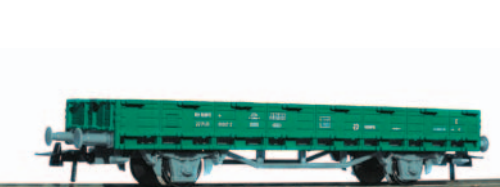
Vagón plataforma de teleros de 2 ejes con caja móvil. Longitud 138 mm.