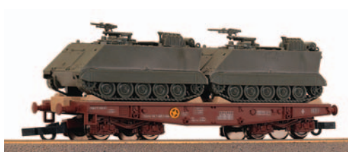
Vagón plataforma transportes especiales de bogies tipo PMM con dos TOA's/M 113 del RCAC Alcántara nº 10. Longitud 124 mm.