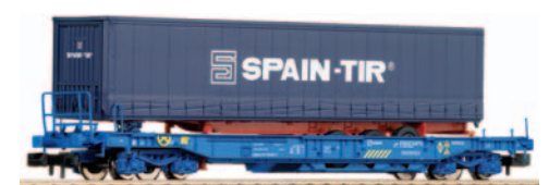
Vagón portacontenedores tipo Sddkkmss con camión Kanguro Spain TIR. Longitud 102 mm.