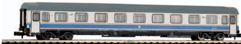
Coche de viajeros 1ª clase serie A 10x 10100 UNE Grandes Líneas. Longitud 165 mm.