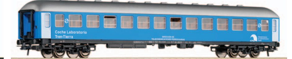
Coche Laboratorio tren tierra de la UNE Mantenimiento de Infraestructuras. Longitud 264 mm.