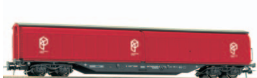
Vagón cerrado de paredes deslizantes JJPD Paquexpres. Longitud 267 mm.