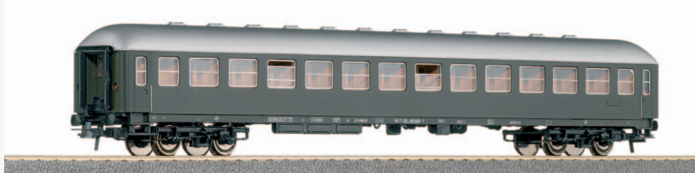
Coche de viajeros para tren militar. Longitud 264 mm.