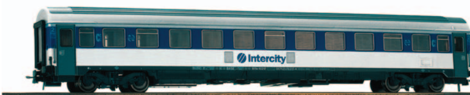
Coche de viajeros 2ª clase Intercity serie B 11x 10200 UNE Largo Recorrido. Longitud 264 mm.