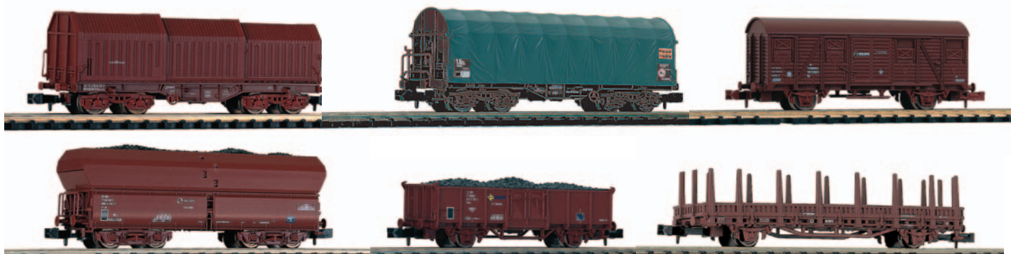
Surtido de 18 vagones de mercancías de la UNE de Cargas de 6 modelos diferentes.