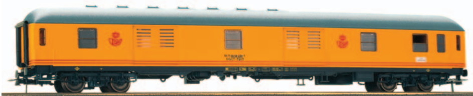
Furgón de Correos serie 3200. Nueva Numeración. Longitud 264 mm.