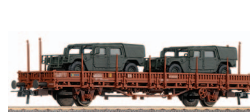
Vagón plataforma de 2 ejes con dos vehículos Hummer. Longitud 138 mm.