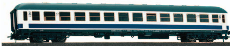
Coche de viajeros 2ª clase serie B12x 12300 UNE Largo Recorrido. Longitud 264 mm.