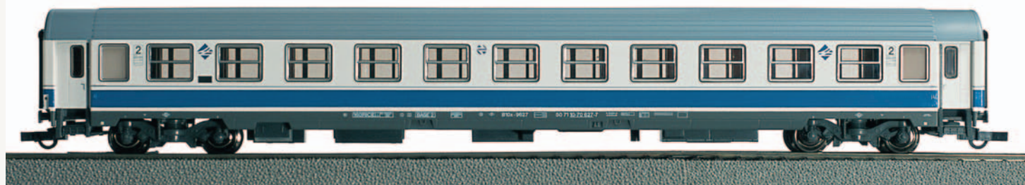
Coche de viajeros 2ª clase Bc10x-9627 UNE Largo Recorrido. Longitud: 303 mm.