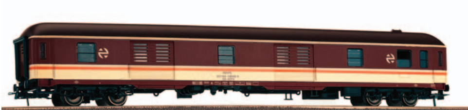
Furgón de paquetería Estrella serie D8 8100. Longitud 264 mm.