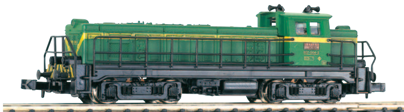
Locomotora diesel-hidráulica de RENFE serie 307. Carrocería de plástico, bastidor metálico, tracción a los 4 ejes y 2 ruedas provistas de aros de adherencia. Longitud 91,3 mm.