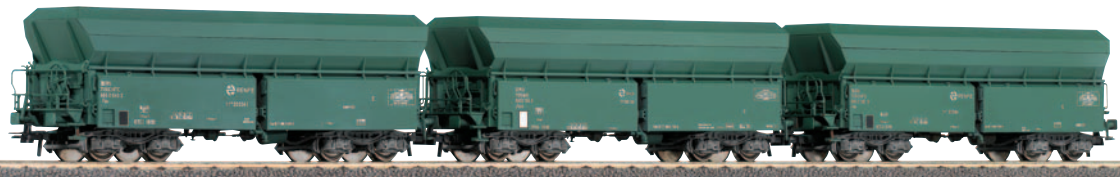
Set de 3 vagones tolva de bogies TT 202.000, con matrículas diferentes. Longitud 111 mm x 3