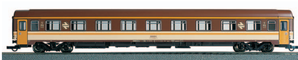
Coche de viajeros 1ª clase AA-10001 Estrella. Longitud 303 mm.