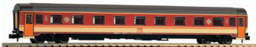
Coche de viajeros Estrella 1ª clase serie AA-10000. Longitud 165 mm.