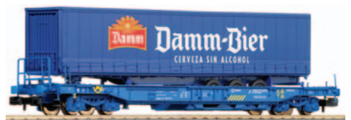
Vagón portacontenedores tipo Sddkkmss con una caja móvil de 40 pies Damm Bier. Longitud 102 mm.