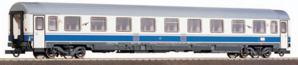
Coche de viajeros clase Preferente A10x-10004 UNE Grandes Líneas. Longitud: 303 mm.