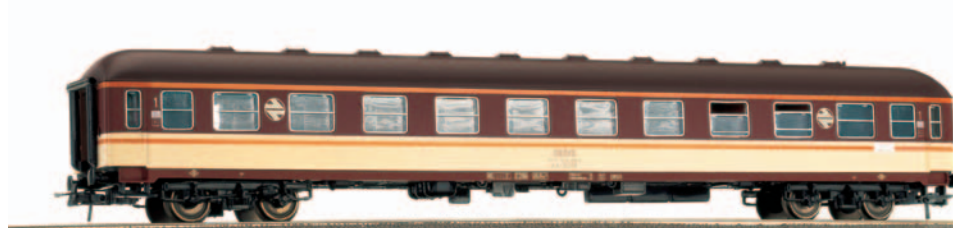
Coche de viajeros 2ª clase BB 8578. Longitud 264 mm.