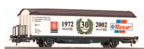
Vagón cerrado de 2 ejes Hbis conmemorativo 30 aniversario Soldat. Longitud 161 mm.