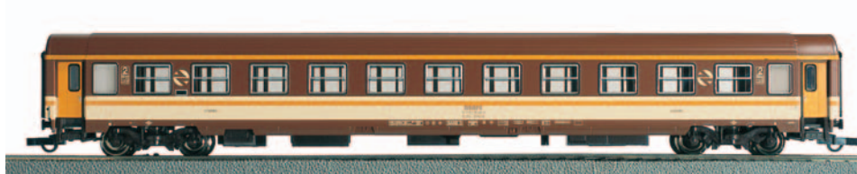
Coche de viajeros Literas de 2ª clase Bc10x-10606 Estrella. Longitud 303 mm.