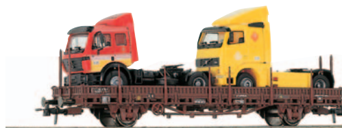
Vagón plataforma de teleros de 2 ejes tipo Ks con dos tractoras Mercedes Benz y Volvo Correos y Ever Green. Longitud 162 mm.