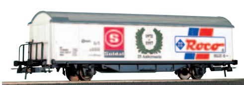
Vagón cerrado de 2 ejes Hbis conmemorativo 25 aniversario Soldat. Longitud 161 mm.