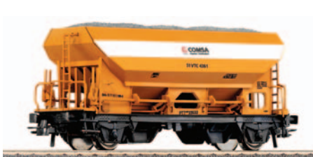
Vagón tolva de 2 ejes COMSA. Longitud 111 mm.