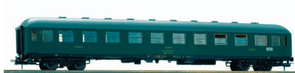
Coche de viajeros Literas 2ª clase BBL 8139. Longitud 264 mm.