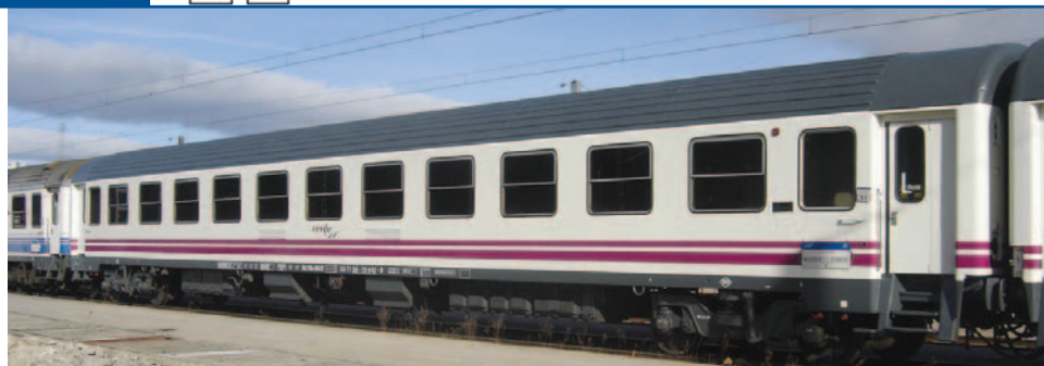
Coche de viajeros Literas de 2ª clase Bc10x-9600 Renfe Explotadora. Longitud: 264 mm.