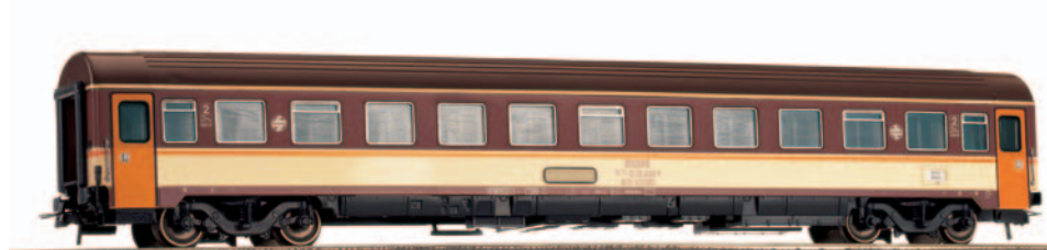
Coche de viajeros 2ª clase serie BB-10.200 Estrella. Longitud 264 mm.