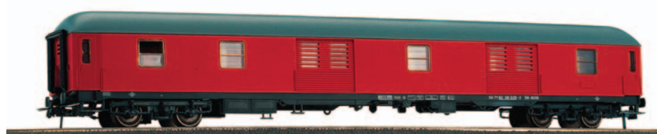
Furgón de paquetería, serie D8 8000. Longitud 264 mm.