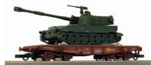
Vagón plataforma transportes especiales de bogies tipo PMM con un carro de combate M 109 A Panz de la D.A. Brunete nº 1. Longitud 124 mm.