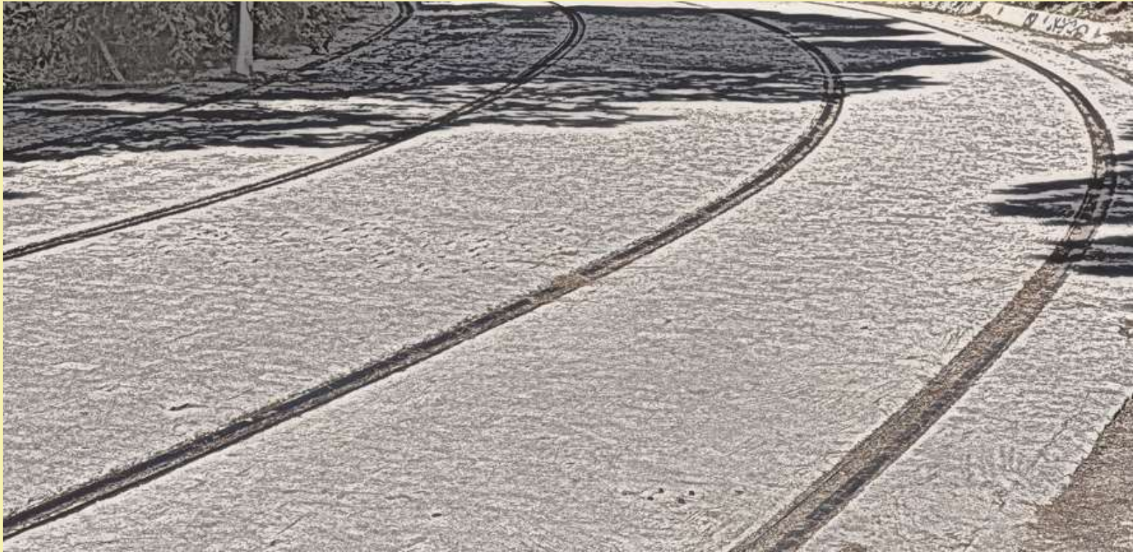
Vías del tranvía de Madrid por la Ciudad Universitaria. 2017 - 09 - 05