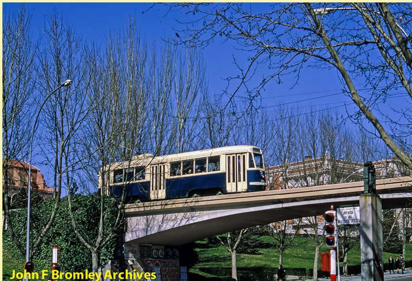
Año 1966. Tranvía PCC 1053 circulando por encima del puente de la Av. de los Reyes Católicos.