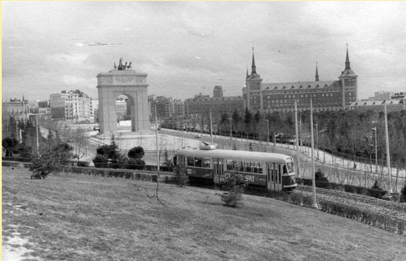
El Paraninfo. Años 1958 - 59.