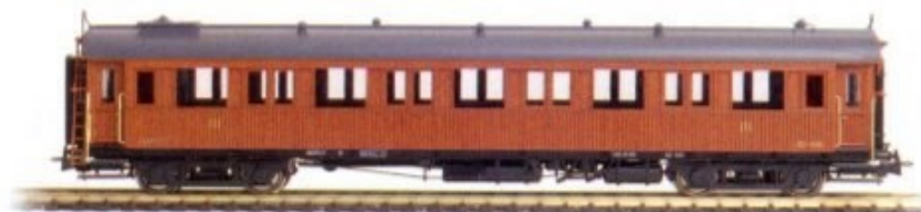
Coches de madera de largo recorrido RENFE Ref. 4403