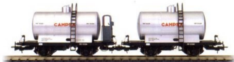
Vagón cisterna de CAMPSA Ref. 4501