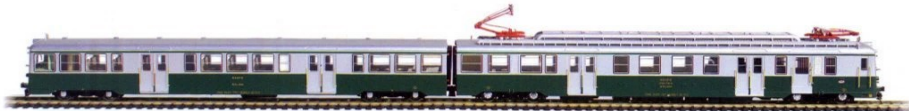
RENFE SERIE 438 (ex UT800) - LIBREA VERDE-PLATA Ref. 4603