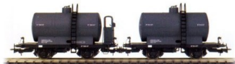
Vagón Cisterna de RENFE Ref. 4502