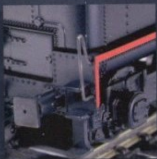
Fotografías modelo preserie