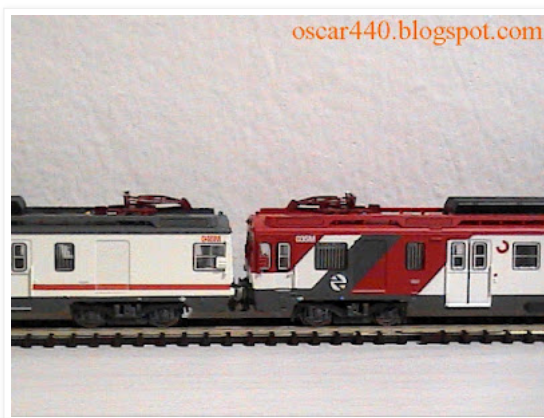
s) Descripción del modelo en miniatura, la UT440.048 de la UNE de Regionales

En esta fotografía propia, podemos ver la nueva adquisición, la UT440 de Arnold con los colores de la UNE de Regionales, posando junto a otra UT440 de Arnold, pero con los colores de la UNE de Cercanías. Lamentablemente, las UT440 de Arnold, no pueden acoplarse entre sí (click para ampliar):