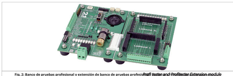
Fig. 2: Banco de pruebas profesional y extensión de banco de pruebas profesional // Decoder Tester and Decoder Tester Extension module