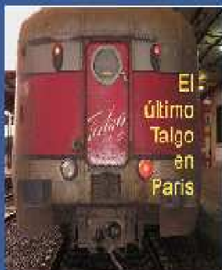
El último Talgo en Paris