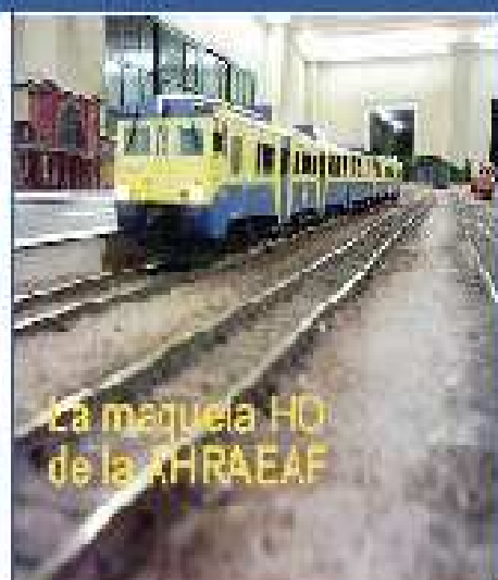
La maquina HO de la ARAEAF