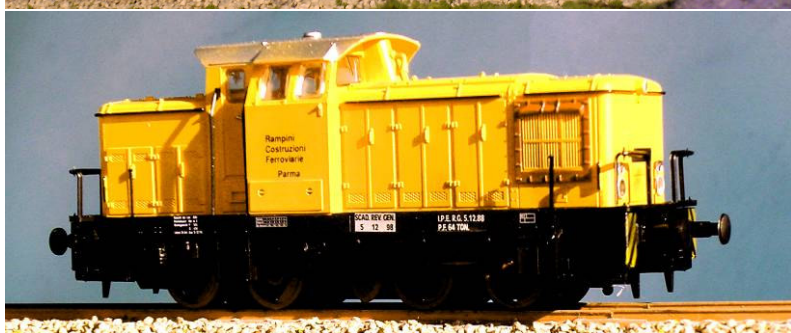
ART.1350 LOCODIESEL (ex V60 DB) Impresa Rampini e/o Valsecchi Epoca IV e V