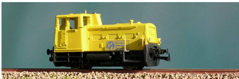
ART.1330. LOCODIESEL (ex 218 FS) nella livrea dell'Impresa Valsecchi Epoca IV e V