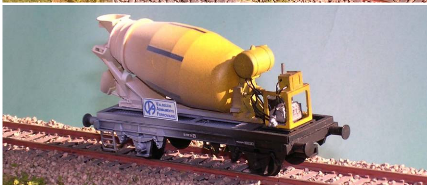
ART.1364 Carro betoniera dell'Impresa Valsecchi con riproduzione del gruppo motore- radiatore, serbatoio gasolio, impianto idraulico con serbatoio olio. Epoca IV.