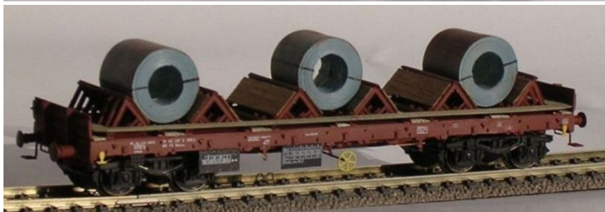
ART. 1620: Carro pianale Rhmms

Con passerelle di servizio. Con carico di coils