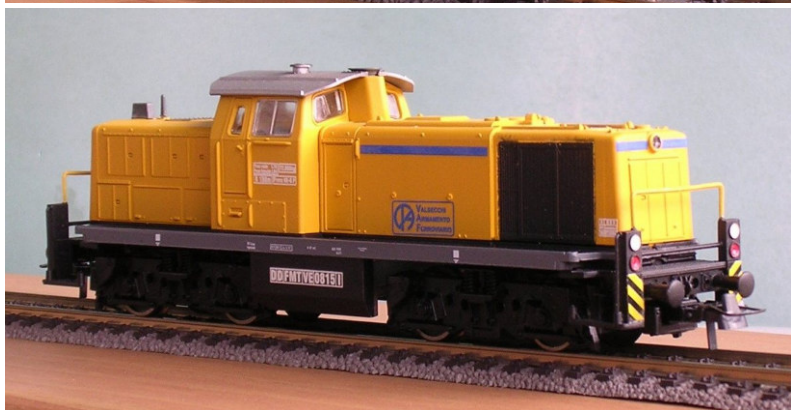
ART.1345 LOCODIESEL (ex V290 DB) Impresa Valsecchi Epoca IV e V