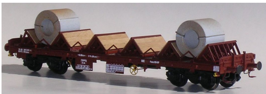
ART. 1610: Carro pianale Rhmms con carico di coils