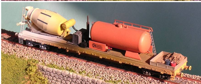
ART.1362 Carro pianale Impresa Valsecchi con betoniera, cisterna, gruppo motore e impianto idraulico ad alta pressione Epoca IV e V