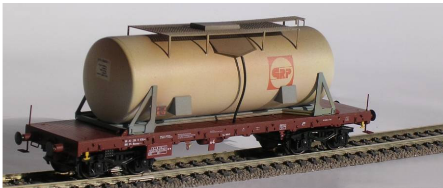
ART. 752: Carro FS Rlmmnps-x

Con cisterna della società G.R.P. per trasporto acido solforico.