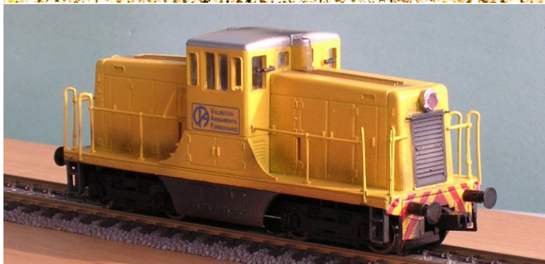
ART.1335 LOCODIESEL (ex GE) Impresa Valsecchi Epoca IV e V