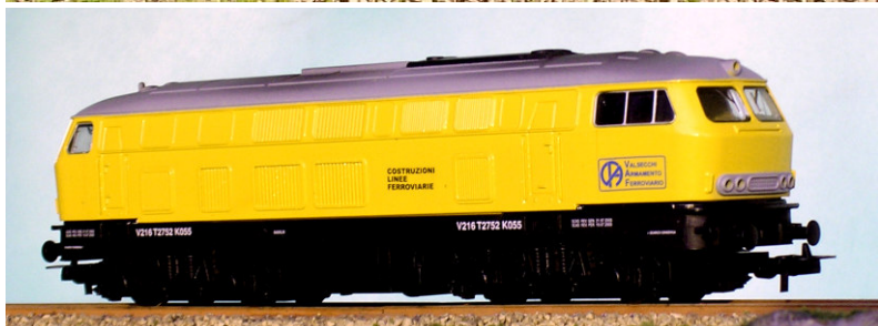
ART.1340 LOCODIESEL (ex 216 DB) con decoder digitale -Impresa Valsecchi Epoca IV e V