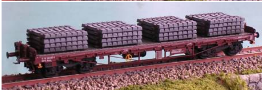
ART.722 Carro pianale FS – Rgmms con carico di traversine in CAP Epoca IV –V ART.1602: come art. 722 versione Metal