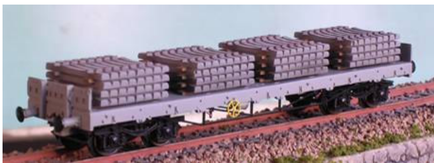
ART. 724: Carro pianale FS – VRgmms con carico di traversine in CAP Epoca IV