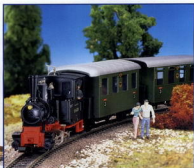
Auch die Liebhaber der De-Schmalspur-Modellbahn kommen mit Magic Train „zum Zuge“.