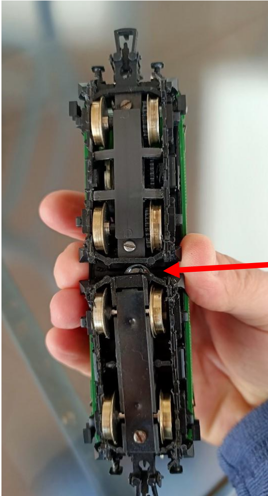
TORNILLO SUJETANDO EL CHASIS A CARROCERÍA