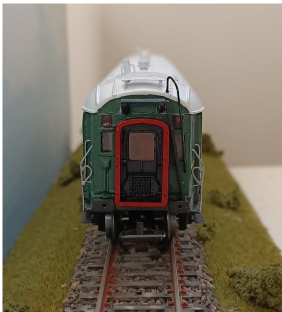
Testero lado escalerilla