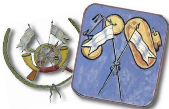
A-V.4.- En 1939 se crearon los "Grupos de Exploración y Explotación", que durante el año siguiente fueron transformados en "Regimientos Mixtos de Caballería". Ya en 1943, al no poderse cubrir las plantillas de sus grupos mecanizados fueron convertidos en "Regimientos de Caballería Independientes" dotados únicamente de escuadrones de sables y de armas pesadas. A la izquierda, dos escudos diferentes que empleó el Grupo de Exploración y Explotación nº4, futuro Numancia.

Al mismo tiempo que era creada la división, se organizaron diez grupos de exploración y explotación, integrados en los cuerpos de ejército, de los que ocho se encontraban en la península y dos en África. Inicialmente, estos grupos debían contar con un grupo de Cazadores, otro de Dragones transportados, una compañía de carros de combate y, curiosamente, un batallón ciclista de Infantería. Sin embargo, sus plantillas nunca se completaron ya que tuvieron que dotarse