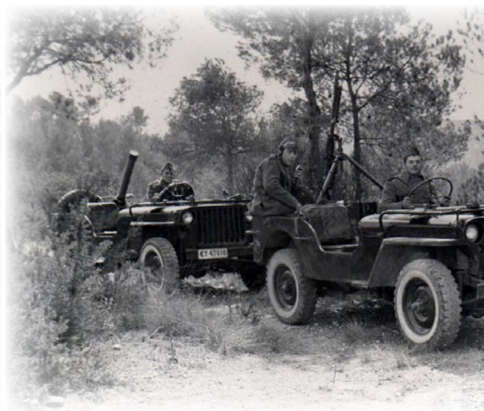
A-V.16.- "Willys" del escuadrón de ametralladoras y morteros en 1961.

con un pelotón de cañones contracarro, un pelotón de ametralladoras antiaéreas y un pelotón de autoametralladoras-cañón); un escuadrón de ametralladoras y morteros (con PLM, una sección de ametralladoras y un pelotón de morteros); y un escuadrón con dos secciones de motociclistas. La revista de comisario del mes de diciembre detalla el siguiente material: un autoametralladora-cañón, 9 blindados (3 en marcha y 6 averiados) 13 , 8 camiones (6 en marcha y 2 en parque), 33 motocicletas con sidecar BMW R-75 (22 en marcha, 5 averiadas y 6 en parque), 5 triciclos benelli, 9 motos, un coche ligero y una furgoneta. Aunque en agosto de 1954 fue reorganizado nuevamente, la plantilla de vehículos se mantuvo prácticamente sin alteraciones.