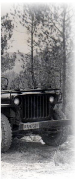
A-V.18.- En 1963 todavía se utilizaban las ametralladoras "MG-13" procedentes de la guerra civil.