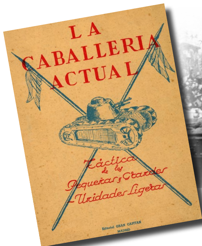
A-V.1.- Tanto este como otros libros de la época demuestran que, a pesar de las enseñanzas de la SGM, algunos “jinetes” eran fervientes partidarios del caballo frente a los medios acorazados.