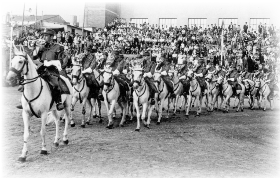
A-V.15.- Banda a caballo del regimiento durante un festival hípico a finales de los 50.