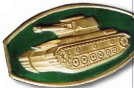
A-V.8.- Escudos de pecho empleados por el Regimiento, con el PzI y el PzIV con fondo verde, indicativo de unidad de montaña.

Según la reorganización de 1943, la Caballería quedó estructurada de la siguiente manera: