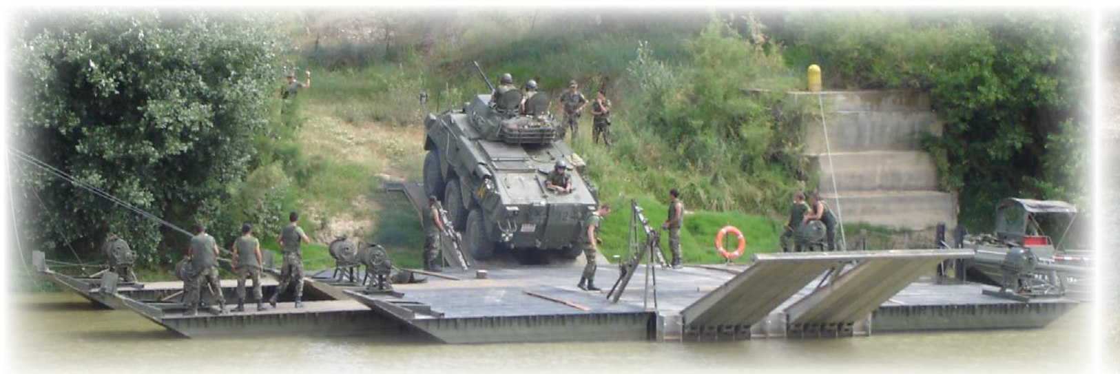
A-V51- "VEC" tras cruzar el Ebro utilizando una compuerta del RPEI 12.

y extranjeros, por lo que tal vez se deseaba mantenerlos en las mejores condiciones posibles, siendo retirados cuando fue abandonado el proyecto.