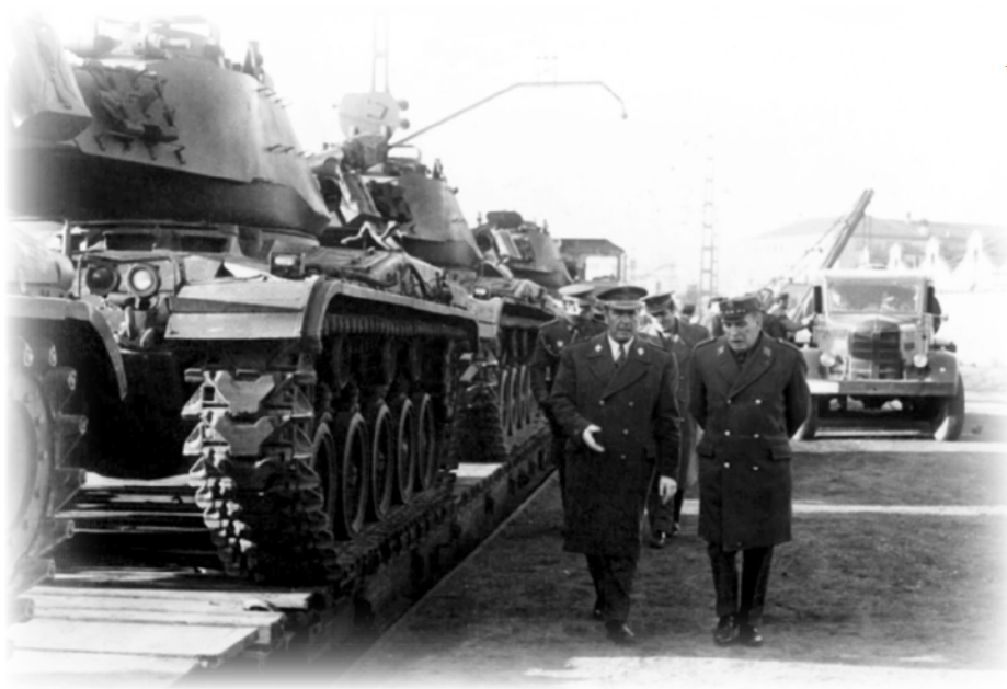
A-V.22.- Con bastante retraso en comparación a otras unidades, por fin en noviembre de 1970 llegaron los primeros carros "M-41" al destacamento habilitado al efecto en San Baudilio de Llobregat, en las proximidades de Barcelona.