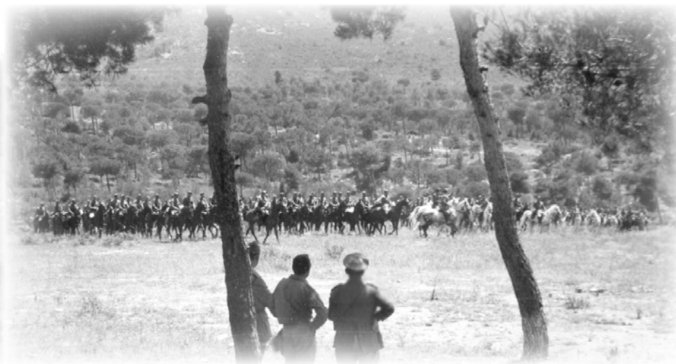
A-V.14.- Aunque a finales de los 50 comenzaron a llegar vehículos todo terreno, la mayor parte del Regimiento continuaba a caballo.

de efectuar una marcha de 30 km sin sufrir alguna avería, existiendo por tanto una sola sección de blindados con tres autoametralladoras-cañón.