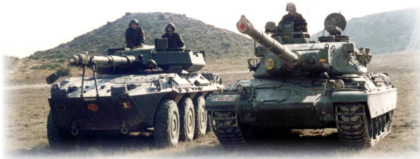
A-V.54.- Pasado y presente del “Numancia” representados por el “AMX-30” y el “Centauro”, durante las pruebas efectuadas con tres vehículos del Ejército italiano entre septiembre y diciembre de 2000.

A finales de 1987, se produjo un hecho que cabe calificar, como mínimo, de curioso: todos los carros M-47 E1 de la unidad fueron sustituidos por M-41 de gasolina, que, tras la disolución de los grupos ligeros DOT, habían sido acondicionados en el parque central de mantenimiento de sistemas acorazados (PC-MASA) nº 2 de Segovia. Los 31 M-47 E1 fueron distribuidos entre los regimientos de Caballería “España” (11), “Almansa” (5), “Farnesio” (2), “Sagunto” (5) y “Lusitania” (5), y el “Flandes” (3) de Infantería. En cuanto a los M-41 tenemos constancia de que, a mediados de 1986, fueron revisados 17 vehículos que deberían dotar al escuadrón de carros del grupo ligero DOT de Inca (Balears), cuya disolución no estaba prevista inicialmente; más tarde, se pensó en entregarlos al grupo ligero “Reyes Católicos” aunque, como ya hemos citado, el año