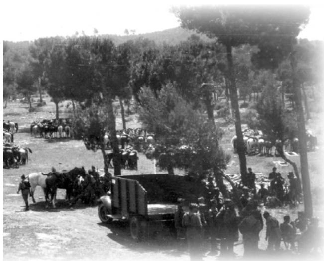
A-V.13.- Hasta 1957, el "Numancia" no recibió sus primeros vehículos de nueva factura.