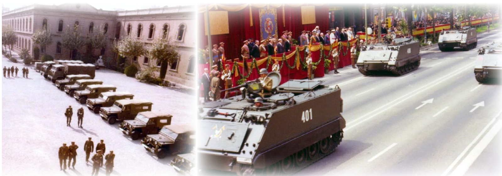
A-V.26.- Como se puede observar, a finales de los 70 la mayor parte de los vehículos del Regimiento eran de fabricación española (Land Rover 88/109 y camiones Pegaso).