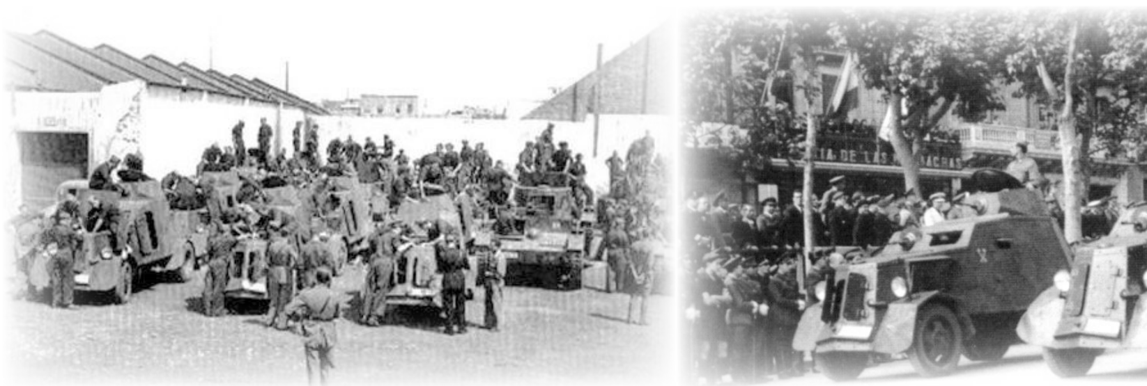
A-V.3.- Carros "T-26" y autoametralladoras Unión Naval de Levante "UNL-35" y "Chevrolet 1937" pertenecientes al Regimiento de Carros de Combate nº 3 creado al finalizar la guerra en Valls (Barcelona). Cuando esta unidad fue disuelta en 1942, sus carros pasaron al RIAC 61 mientras que los autoametralladoras terminarían en el "Numancia".

ción en Campamento (Madrid), al tiempo que cambiaron las denominaciones de sus unidades por las de "Regimientos de Sables nº 1 al 4 de la División de Caballería" 2 . Poco tiempo después, durante 1940, fue articulada en dos brigadas, siendo dotada además de Artillería, Ingenieros (Zapadores y Transmisiones) y diversos servicios. Con fecha 18 de abril fue organizado el regimiento nº 5 que, junto al 3, constituyó la Brigada II de guarnición en Aranjuez, que pasó a denominarse Mecanizada. La división se transformó en mixta y debía contar con elementos de reconocimiento (jinetes, ciclistas y motociclistas), de combate y maniobra (jinetes y ametralladoras), y de ocupación del terreno y apoyo (ciclistas, motociclistas y dragones en vehículo).