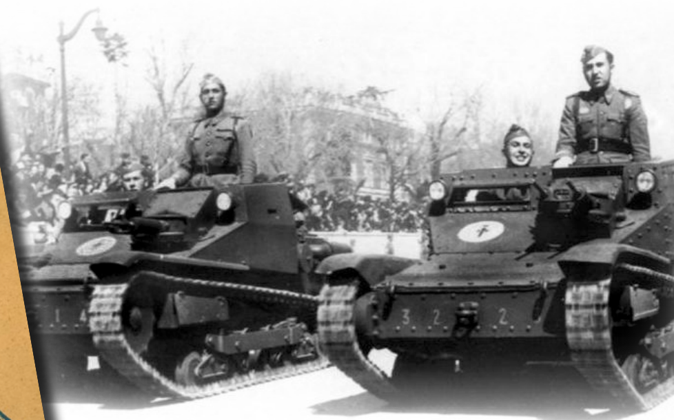
A-V.2.- En julio de 1939 se creó la División de Caballería “Jarama” que, en parte, fue dotada con materiales excedentes de la Guerra Civil, como estos “CV-35” que vemos desfilando en Madrid. Se ve perfectamente el emblema con la cruz de Santiago que posteriormente empleó la Brigada del mismo nombre hasta su desaparición.

precisamente, a estas grandes unidades. Por lo que a nosotros toca, creemos que cambiarnos de ropaje para vestir la rígida armadura, no nos va para andar por casa, entre otras muchas razones, porque nos resta libertad de movimientos para recorrer lo intrincado de sus compartimientos”. Más adelante, tras hacer un curioso análisis de la SGM, finaliza el apartado dedicado a “La Caballería y la Mecanización” 1 con el siguiente párrafo: “En definitiva, estimamos que las fuerzas mecanizadas aéreas y terrestres, constituyendo el modo más poderoso y rápido para formar masa y aplicarla en el punto decisivo, no son más que nuevas Armas que, en vez de desplazar a las viejas, necesitan de ellas para multiplicar sus efectos, así como éstas se valen de las primeras para aumentar su potencia, asegurando, con la cooperación, la máxima eficacia en la batalla moderna”. Por supuesto, también se pueden citar otros libros y numerosos artículos publicados en diferentes revistas militares, en los que se mantenían posturas claramente favorables a la sustitución de las unidades de sables por otras blindadas y acorazadas. Como ejemplo, en el artículo “La Caballería en la batalla futura” incluido en el número 1 de la revista Ejército (febrero de 1940), el general García Valiño, tras hacer una reflexión sobre las heroicas e inútiles cargas de los jinetes polacos contra los blindados alemanes, mantenía lo siguiente: “la solución, para