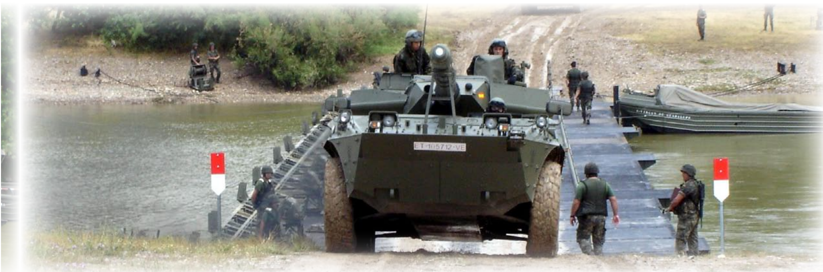
A-V.53.- Por primera vez, los “Centauro” españoles cruzaron el río Ebro el 13 de junio de 2005.

M-113 por otras similares de la familia BMR permitirá, cuando este proceso finalice, que ambas unidades incorporen únicamente vehículos de ruedas 25 .