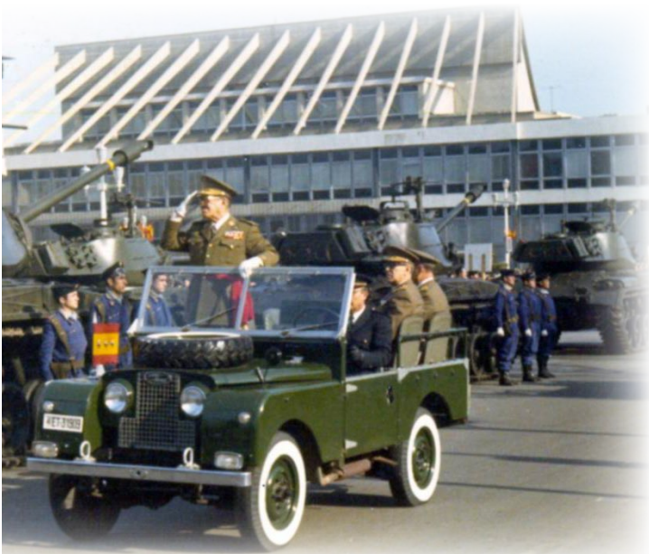
A-V.22.- El General Jefe de la División de Montaña "Urgel nº 4" pasando revista con motivo del Desfile de la Victoria de 1971.