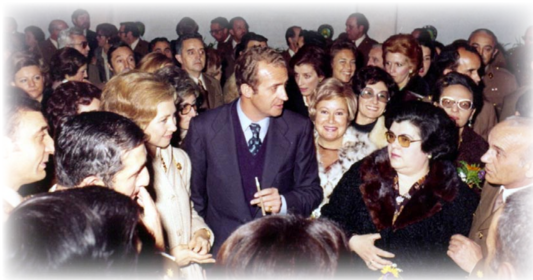
A-V.24.- En 1976, SSMM. los reyes asistieron a un acto celebrado en instalaciones del "Numancia" para conmemorar el aniversario de la fundación de la Academia General Militar.