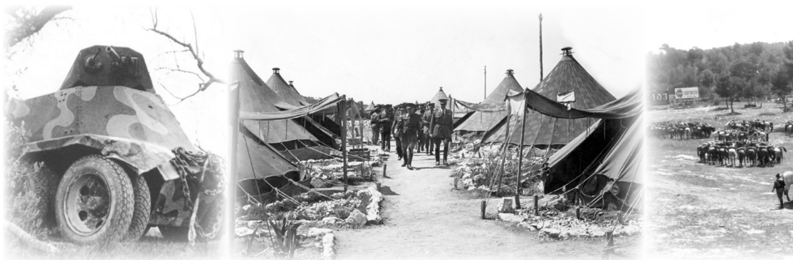
A-V.11.- En 1952, el “Numancia” recibió dos autoametralladoras “Chevrolet 1937”, una de ellas armada con un cañón de 37 mm como la de la imagen.