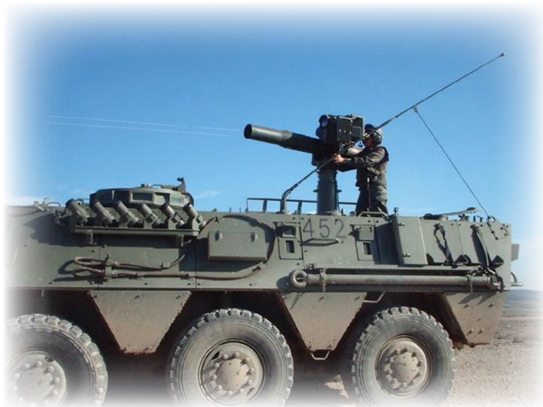
A-V.49.- “BMR-M1” tras el lanzamiento de un misil Tow.