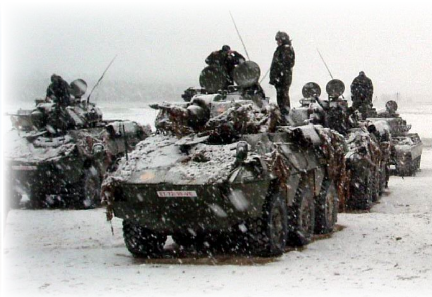
A-V.50.- Imagen poco usual de un ELAC en San Gregorio en febrero de 2004.

A finales de 1987, se produjo un hecho que cabe calificar, como mínimo, de curioso: todos los carros M-47 E1 de la unidad fueron sustituidos por M-41 de gasolina, que, tras la disolución de los grupos ligeros DOT, habían sido acondicionados en el parque central de mantenimiento de sistemas acorazados (PC-MASA) nº 2 de Segovia. Los 31 M-47 E1 fueron distribuidos entre los regimientos de Caballería “España” (11), “Almansa” (5), “Farnesio” (2), “Sagunto” (5) y “Lusitania” (5), y el “Flandes” (3) de Infantería. En cuanto a los M-41 tenemos constancia de que, a mediados de 1986, fueron revisados 17 vehículos que deberían dotar al escuadrón de carros del grupo ligero DOT de Inca (Balears), cuya disolución no estaba prevista inicialmente; más tarde, se pensó en entregarlos al grupo ligero “Reyes Católicos” aunque, como ya hemos citado, el año