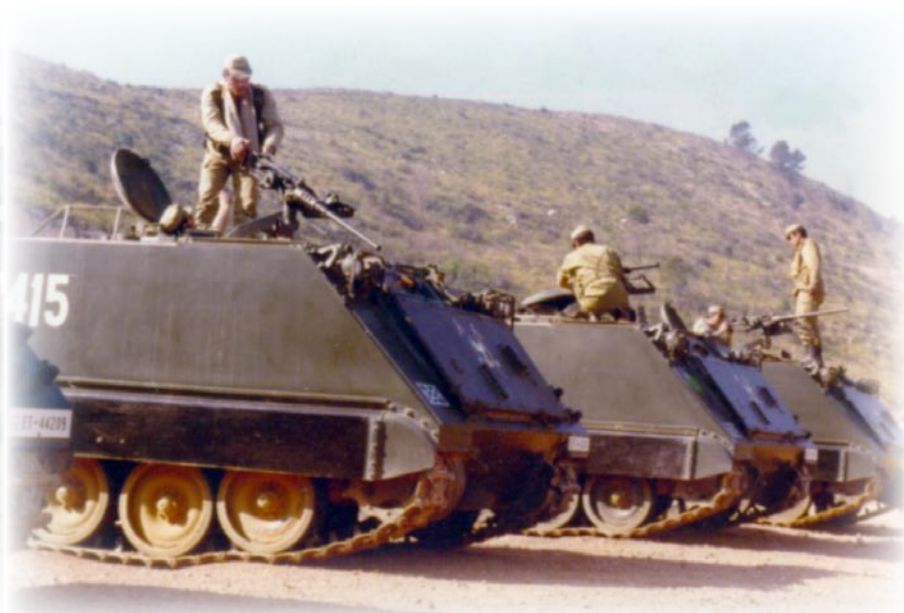
A-V.23.- La llegada de 28 TOA,s. "M-113" en 1974 permitió activar el Escuadrón Mecanizado.

y misiones: las de intervención inmediata (FII) y las de defensa operativa del territorio (DOT). Las primeras fueron equipadas e instruidas especialmente para la guerra convencional y nuclear limitada, mientras que las segundas se orientaron hacia la lucha subversiva, infiltraciones y desembarcos.